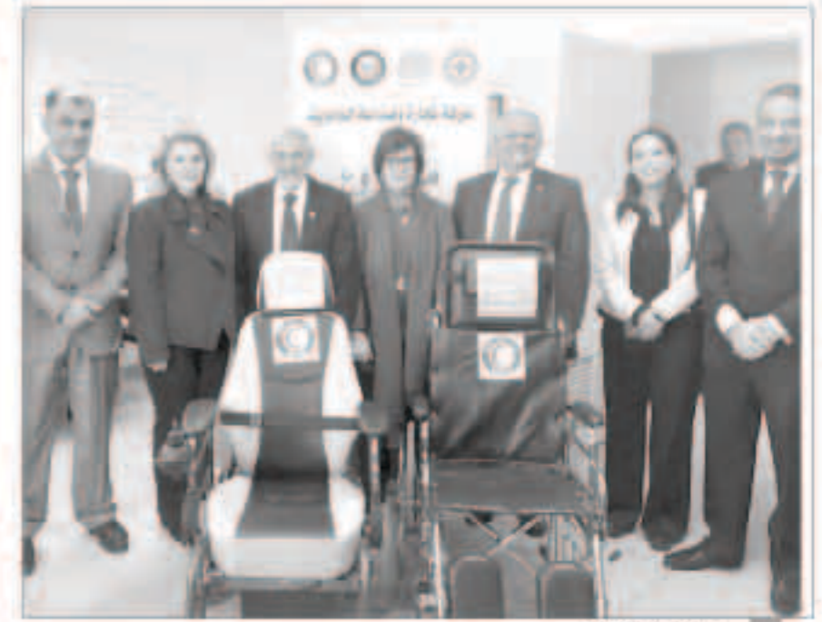
صورة تذكارية للوفدين