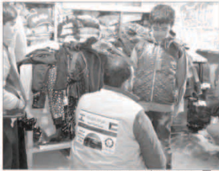
فريق النجاة يساعد طفلاً في اختيار ما يناسبه من ملابس

قدمت جمعية الهلال الأحمر الكويتي امس 70 جهازاً خاصاً لذوي الاحتياجات الخاصة والاعاقة الشديدة من النازحين السوريين في لبنان بترفع كريم من غرفة تجارة وصناعة الكويت بالتنسيق والتعاون مع الصليب الأحمر اللبناني. وأعرب رئيس مجلس إدارة الجمعية الدكتور هلال السائب في تصريح ل(كونا) عن شكره لغرفة التجارة والصناعة لدورها وساهمتها في مشاريع الجمعية الإنسانية داخل وخارج الكويت ما يؤكد الدور الإنساني الكبير لدولة الكويت. وأشاد بالتعاون الصليب الأحمر اللبناني مع الجمعية وبوره في تشغيل عمل فريق الجمعية وحملاتها الإغاثية منذ اندلاع أزمة النزوح السوري على لبنان مشيراً