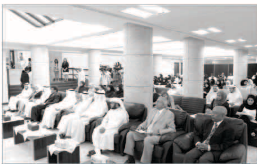
جانب من الحضور خلال الندوة

وأضاف د.الكندري: «تناولت هذه الندوة البعد الصحي، والاجتماعي والثقافي، والنفسية، والتربوي والإعلامي، والأمني للطفل من خلال خمس جلسات موزعة على مدار يومين تبدأ في تمام الساعة التاسعة والرابع من صباح يوم الإثنين، وتنتهي في تمام الساعة الواحدة من بعد الظهر يوم الثلاثاء، وسيشارك في هذه الندوة نخبة مميزة من الأساتذة والأكاديميين المختصين من جامعة الكويت ومن خارجها من المؤسسات العلمية ذات الصلة، حيث تناول الجلسة الأولى قضايا خاصة بصحة الطفل الجسدية والاجتماعية، والجلسة الثانية ستتناول القضايا الإعلامية والنفسية، ومن ثم قضايا تربوية في الجلسة الثالثة، والجلسة الرابعة عن العنف والمخدرات والإساءة للطفل، وأخيراً الجلسة الختامية للتوصيات الخاصة بالطفل، وتتطلع أن تخرج من هذه الندوة بمجموعة من التوصيات والرؤى التي تساعد صاحب القرار في اتخاذ الإجراءات المناسبة..»