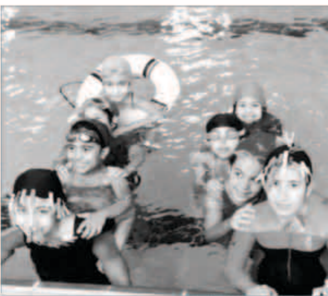
جانب من فعاليات الدورة