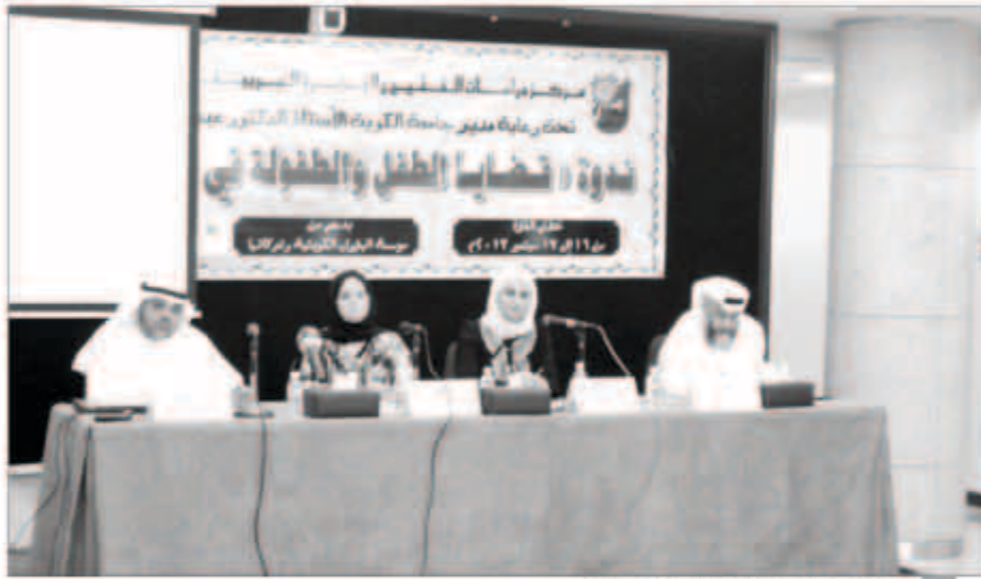
جلسات مستمرة في ندوة «دراسات الخليج»