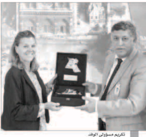
تكريم مسؤولي الوفد