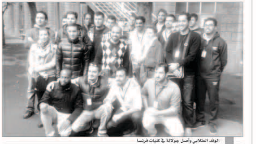
الوفد الطلابي واصل جولته في كليات فرنسا