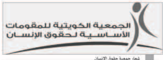
شعار جمعية حقوق الإنسان

كرامة الطفل الإنسانية، عملاً في ذلك لحكم الفقرة 2، من المادة 28» من الاتفاقية لحقوق الطفل، والتي تنص على أن «تتخذ الدول الأطراف كافة التدابير المناسبة لضمان إدارة النظام في المدارس على نحو يتماشى مع كرامة الطفل الإنسانية ويتوافق مع هذه الاتفاقية». وأيدت استغرابها بقولها: إنه وإن كانت الكويت حريصة على إدماج مناهج تعليم حقوق الإنسان ضمن المقررات الدراسية للطلبة والطالبات في مراحل التعليم المختلفة، فإنه يجب من باب أولى وفي المقام الأول تعليم المدرس ماهية الحق الإنساني للطفل وتوعيته بفهمه الكرامة الإنسانية لأطفالنا، ولعل هذا الأمر من المفترض أنه بات مسلماً به، خاصة بعد أن اعتمدت الكويت وتبنت الخطة العربية للتربية على حقوق الإنسان والتي أشرفت عليها جامعة الدول العربية واعتمدها جميع الدول العربية في مؤتمر القمة العربي الذي عقد بمشقة عام 2008 والتي تهدف إلى إرساء حقوق الإنسان في المنظومة التربوية في مختلف