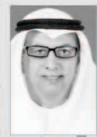
د. بدر مال الله

كشفت مدير عام المعهد العربي للتخطيط د. بدر عثمان مال الله عن زيارة رسمية قام بها وفد المعهد برئاسة للجمهورية اليمنية، شملت العاصمة صنعاء وجامعة حضر موت، التقى فيها وزير التخطيط اليمني د. محمد سعيد السعيد و نائبه مطهر العباسي، مشيراً لإجتماع عقد بمشاركة وكلاء الوزارة والوكلاء للمساعدين تم فيه استعراض الوضع التنموي في اليمن ووضع إدارة التنمية وأبرز التحديات التي تواجهها، وأوضح مال الله - في تصريح صحافي لوسائل الإعلام - أنه أكد خلال لقائه المسؤولين اليمنيين أن المعهد شريك أساسي في التنمية بالدول الأعضاء من منطلق حرص دائم على توطيد علاقات التعاون ومد يد العون لها للوصول لصيغة مقبولة تكفل لها الانطلاق إلى آفاق التنمية، لافتاً إلى أن اليمن الشقيق يتصاهب لإطلاقة جديدة على أصعدة تنموية وخصوصاً في ظل الوضع بعد الحوار الوطني، مشيداً بما لمسه من رغبة حثيثة وتوجيه قوية من المسؤولين اليمنيين في تعزيز الشراكة مع المعهد العربي للتخطيط.