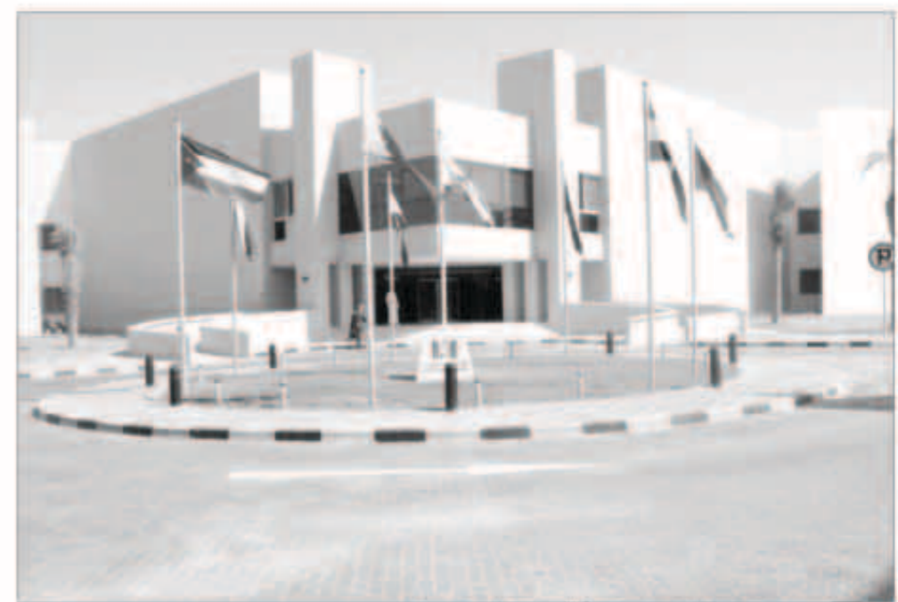
الجامعة المفتوحة تعلن المضي قدماً في خطتها الاستراتيجية