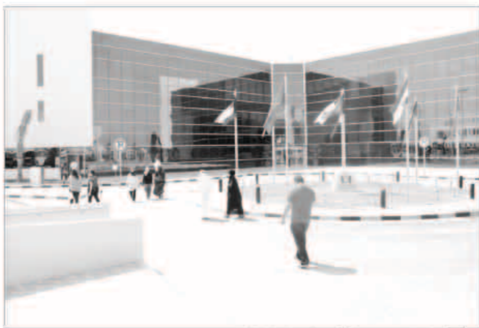
نادي الخريجين يعد إضافة جديدة لخدمات الجامعة

في التواصل مع سوق العمل و تعريف المجتمع المحلي بالجامعة ورسالتها ورؤيتها واهدافها، كما يقوم النادي بدعم الصورة المتميزة للجامعة لدى المجتمع و وسائل الإعلام مؤكداً بالوقت ذاته أن خريجينا يمتلكون من الخبرات والمميزات الشخصية التي تؤهلهم للمساهمة في تطوير الجامعة كأحد أعمدة التنمية المستدامة من خلال التعليم القوي الجاد المعتد عالمياً ومحلياً، هذا وبعنا د. العجمي كافة خريجي الجامعة لحضور الحفل المقام على شرفهم والذي يمثل فرصة لتعارف الخريجين مع بعضهم البعض منوهاً أن الجامعة ستعاود بعد الحفل دعوة الخريجين لإختبار ممتلكهم ولجان النادي وتشكيل هيئتهم الإدارية والعمل على تنظيم فعاليات دورية برعاية فرع الجامعة بدولة الكويت.