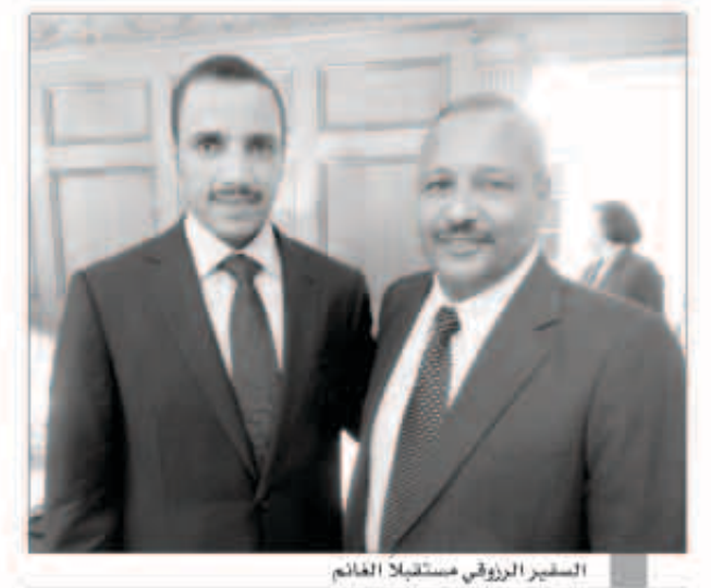
السفير الرزوقي مستقبلاً الغانم

الجميع التقية إلى هذه المشكلة التي ستعكس سلباً على جميع مجالات الحياة لا سيما الاقتصاد المحلي والمؤشرات التي تستعطيها حول عدم جاهزية الدولة ومواكبتها وتحديثها للاحتياجات في هذا القطاع الحيوي. وأشار إلى أن الوزارة تنتج 14 ألف ميغاوات والاستهلاك الفعلي يصل إلى 12100، وهناك ما يقارب 700 ميغاوات هدر في الإنتاج، فلماذا نتقلع الكهرباء؟