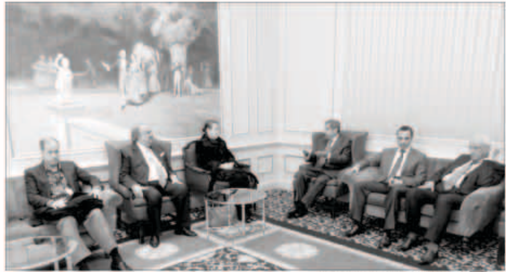
مرزوق الغانم خلال زيارته إلى بروكسل

بروكسل - «كونا» - ثمن رئيس مجلس الأمة مرزوق علي الغانم أمس، الجهود التي تبذلها مؤسسة جائزة عبدالعزيز سعود البابطين للإبداع الشعري في سبيل تقريب الشعوب وتحاور الحضارات والنقاش البناء سعياً للمصالح المشتركة بين الشعوب. وقال الرئيس الغانم في تصريح له: «كونا» في مقر إقامة الوفود «اتشرف بتلبية الدعوة للشاعر العبد العزيز البابطين في حضور اللقاء كلمة افتتاح مؤتمر الحوار العربي الأوروبي في القرن الحادي والعشرين نحو رؤية مشتركة» للزعم انطلاقاً غداً هنا في العاصمة البلجيكية بروكسل وفي مقر اتحاد البرلمان الأوروبي.