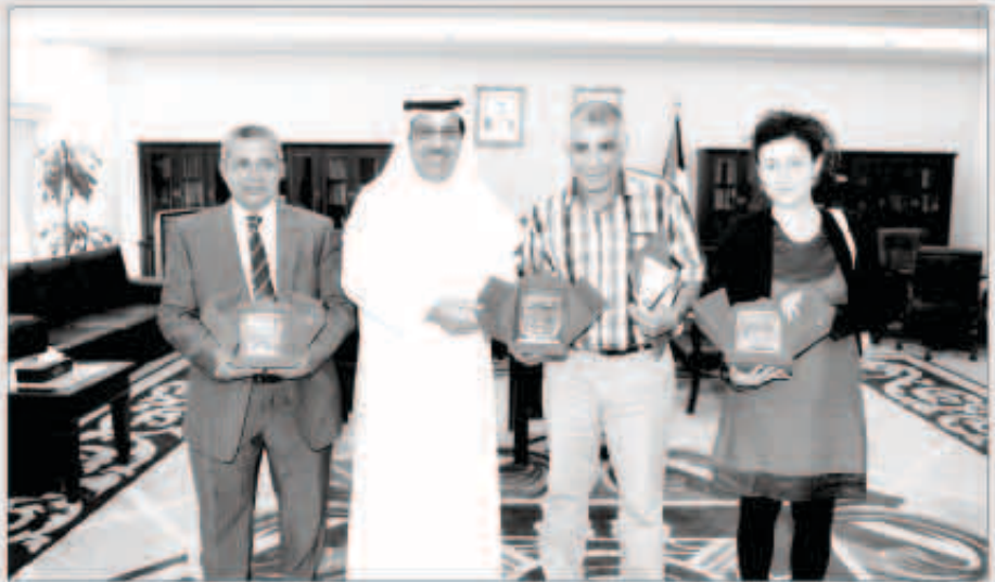
مبارك الخرينج مستقبلاً وفد حقوق الإنسان الفيدرالي

استقبل نائب رئيس مجلس الأمة مبارك الخرينج في مكتبه بمجلس الأمة أمس، وفد حقوق الإنسان الفيدرالي الزائر للبلاد.