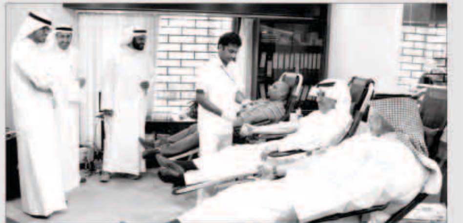
موظفو هيئة القصر خلال تبرعهم بالدم