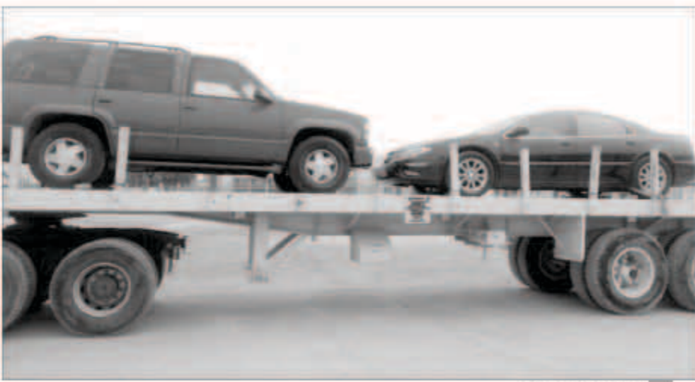
رفع السيارات المهمله