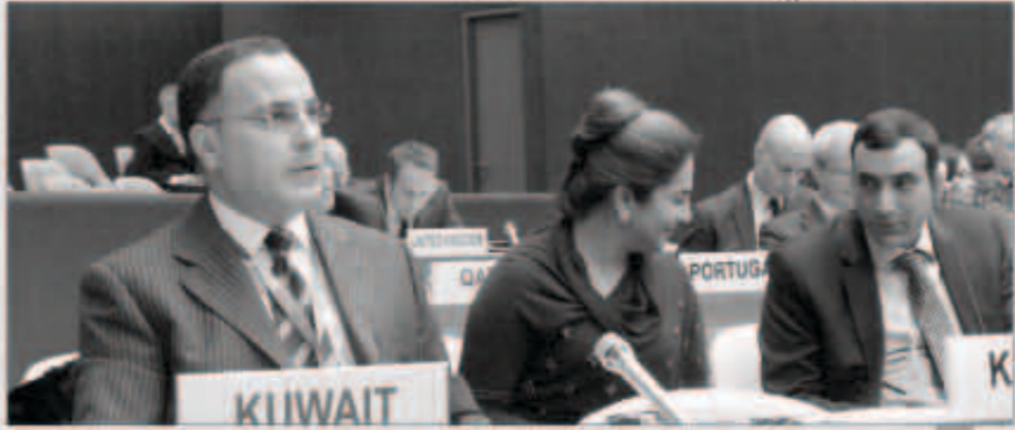
جانب من مشاركة الكويت في اجتماعات الأمم المتحدة

التي تحققت في السنوات الأخيرة. وأوضح أن تحقيق أهداف الاتفاقية يتطلب أطارا من الشراكة والتعاون بين الدول المتضررة والجهات الفاعلة لتعزيز القدرة الوطنية بما يخدم ضحايا الألغام ويضفي على هذه الأفعال. وأكد السفير الغنيم التزام الكويت الكامل بأحكام هذه الاتفاقية والعمل على تحقيق عالميتها كأحد أهم الاتفاقيات الدولية التي تعالج التحديات والانتشار الإنساني للأسلحة الفتاكة المحظورة دوليا.