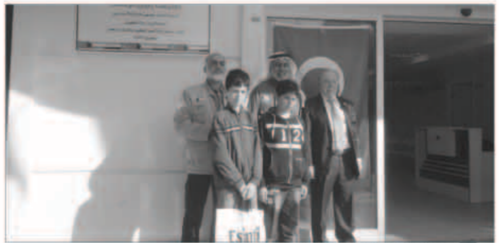
مدرسة بنیان الرحمة القائمة ببيروت كويتية

هم في سن المدرسة دون تعليم حتى نهاية العام حسب الغنيمية. وقد طالب العنجرى الذي استطاع من خلال زيارته المتتالية عبر إشرافه على قوافل الرحمة الإغاثية والتي تجاوزت 113 قافلة حتى الآن أن يقدم وصفا للواقع ومعرفة احتياجاته، طالب الشعوب العربية والاسلامية عامة والخليجية خاصة