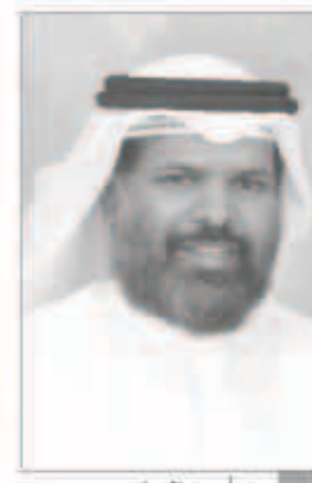
د. أحمد الهيبي

وصيانتهما والارتقاء بمستوى الخدمات والمعلومات والبيانات التي يتم تقديمها لمختلف وزارات الدولة والجهات الحكومية بشكل مستمر ومتواصل. وأوضح الهديبة بأن وزارة الدولة لشؤون مجلس الأمة دشنت منذ سنوات موقعها على شبكة الإنترنت العالمية يضح نظاما ليا يختص بتغطية جميع أعمال مجلس الأمة وهذه الألية تضمن مساعده الوزراء والأعضاء والمواطنين في الإطلاع على سير عمل مجلس الأمة وأهم ما يدور فيه إضافة إلى إبراز إنجازات جهود أبناء الوزارة فضلا عن قيام أبناء الوزارة على تطويرها