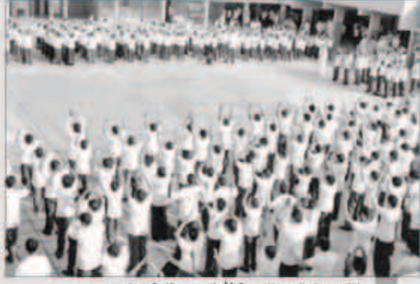
الكويت تحتضن النسبة الأعلى من طلبة الخليج

الرياض - «كونا»: احتلت الكويت المرتبة الأولى في عدد الطلاب الخليجيين الذين يدرسون بالمدارس الحكومية في الدول الأعضاء الأخرى مسجلة نسبة 42 في المئة من العدد الإجمالي المقرر بنحو 40 ألف طالب وطالبة. وأظهرت احصاءات تضمنها تقرير أصدرته الإمانة العامة لمجلس التعاون أمس بمناسبة انعقاد القمة الخليجية بدولة الكويت في العاشر من شهر ديسمبر الجاري أن عدد الطلاب في دولة الكويت من دول مجلس التعاون بلغ 16504 و7726 طالباً و8778 طالبة.