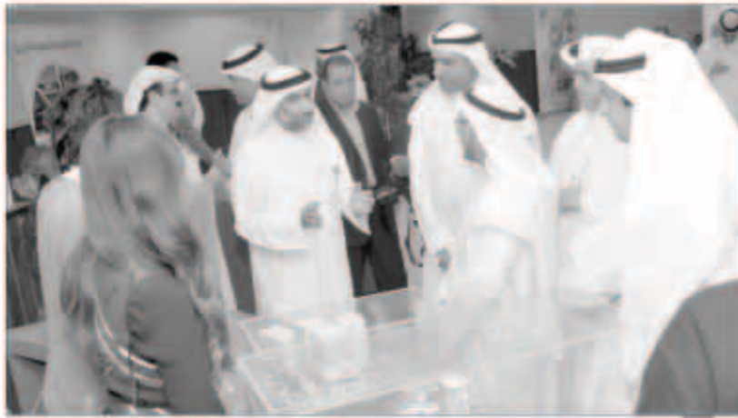
الخياط خلال جولته بالمعرض