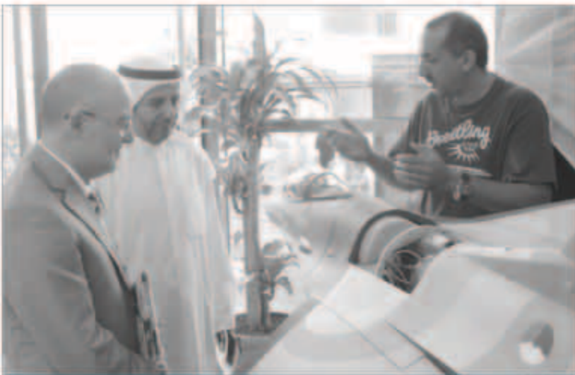
ويستمع إلى شرح عن العروضات