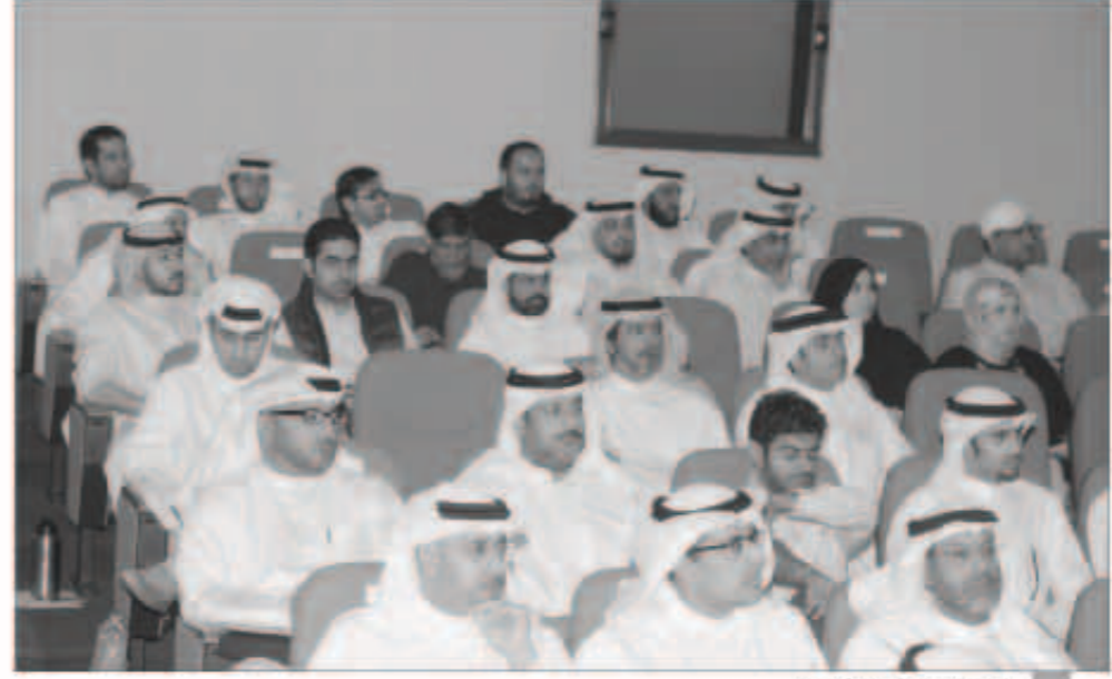
الحضور خلال ورشة العمل