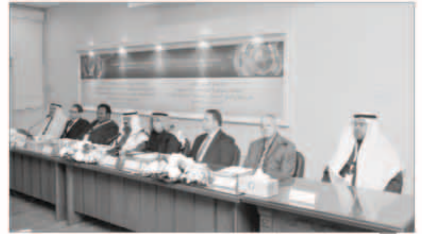
البرجس والقيادات المشاركة

بهدف العمل على توفير مأوى للاسر السورية النازحة من جراء الأحداث الدموية