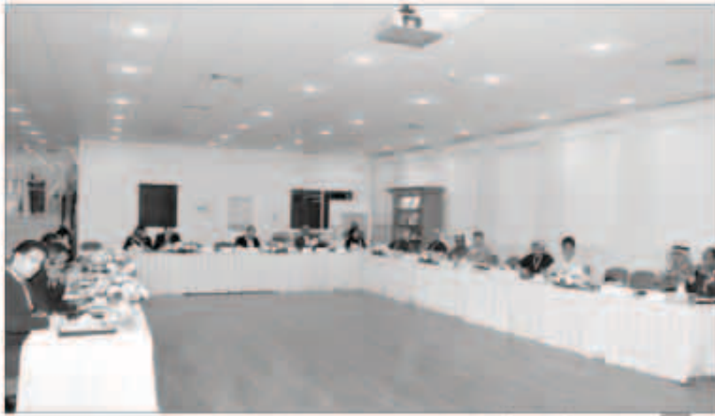
جانب من فعاليات الاجتماع