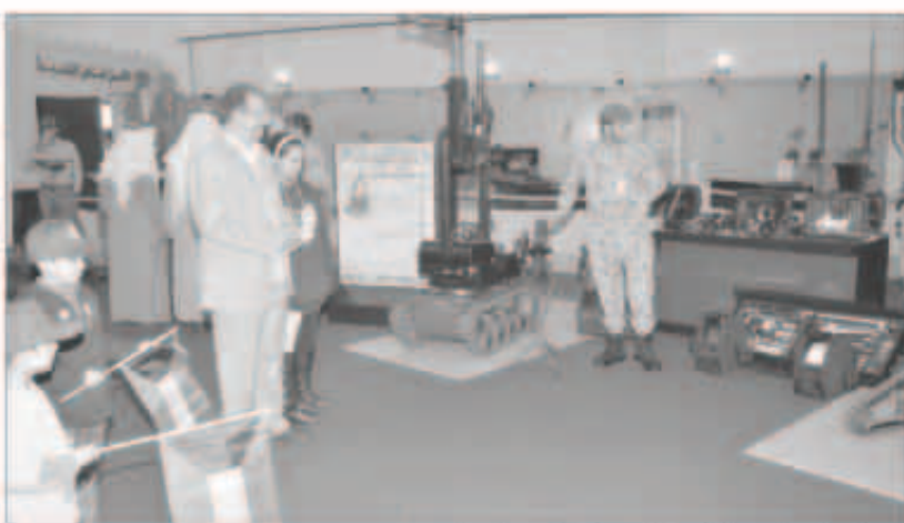
جانب من العروض وسط إقبال جماهيري