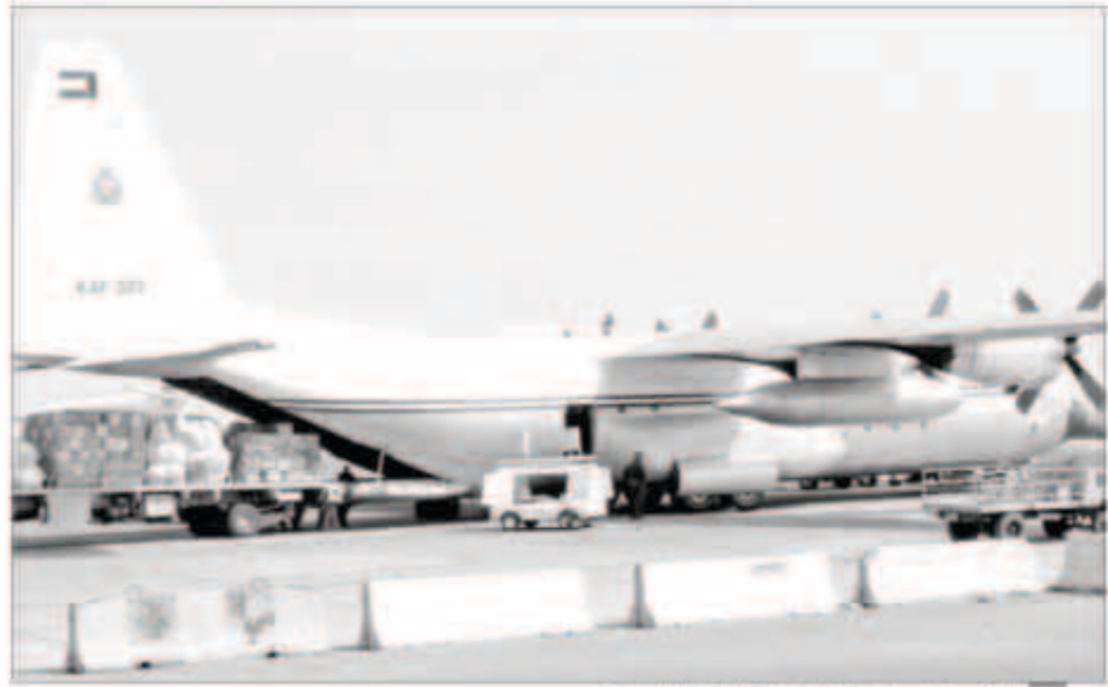
الكويت تواصل إرسال المساعدات الإغاثية للسودان

■ «الهلل الأحمر»: مستمرون في إرسال المعونات ونستعد لتنظيم رحلة أخرى خلال الأيام المقبلة