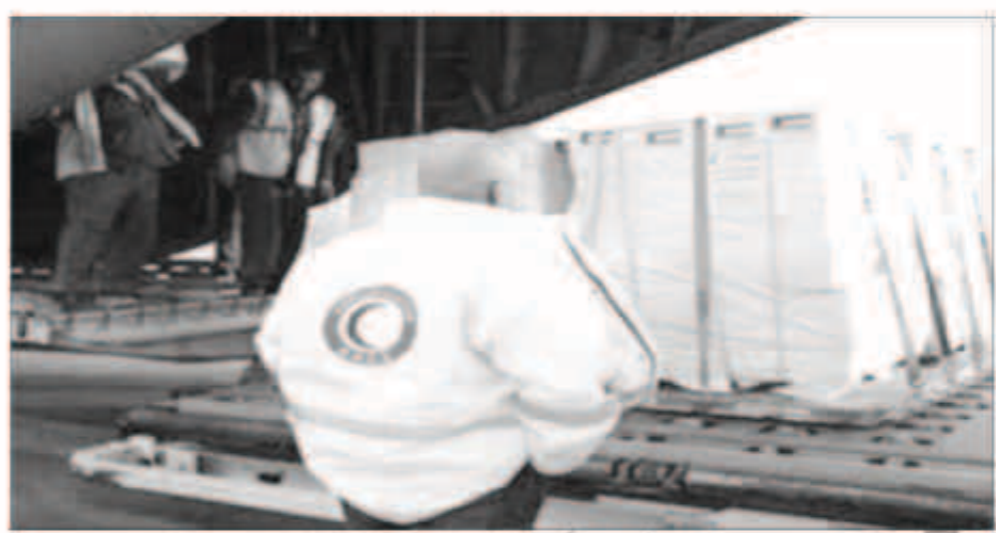
الطائرة السابعة يتبعها 3 طائرات أخرى تليها

والسيول التي تضررت منها الألاف من الشعب السوداني.