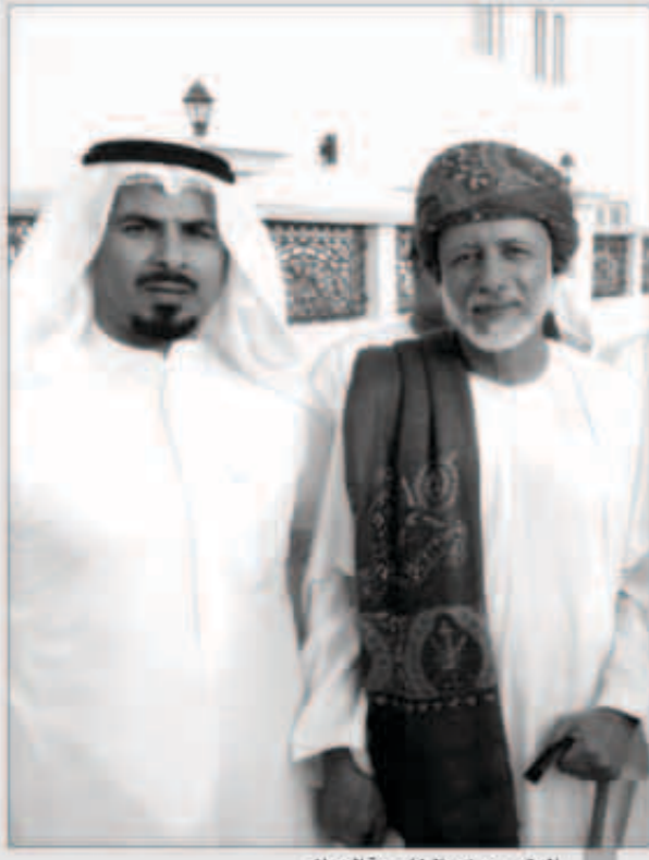
العتيبي ووزير الخارجية العماني

أشاد بدور وزير الخارجية العماني في رعاية المساجد العتيبي: أهل الخليج العربي جبلوا على الاهتمام ببيوت الله