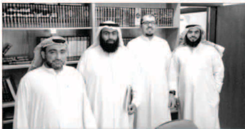
المشاركين في دورة فن كتابة الخبر