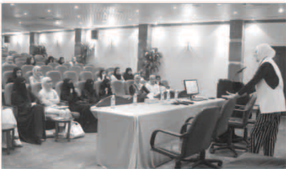
مجموعة من فعاليات على هامش المعرض

ونظمت وحدة التسجيل والجدول الدراسي محاضرة بعنوان «مستقبلي بعد التخرج» استقبلت فيها خريجات الأقسام العلمية وعرضت الخريجات تجربتهن الدراسية في كلية البنات الجامعية ومجال عملهن بعد التخرج لتستفيد منها طالبات الكلية. وكذلك استقبلت الكلية طالبات المرحلة الثانوية وتم عرض فيلم قصير لهن حول الأقسام التي تطرحها الكلية وشرح شروط القبول، وتم أخذ الطالبات في جولة في المعرض للتعرف على التخصصات المطروحة والاستفادة من الجهات المشاركة من مراكز جامعة الكويت مثل مركز التقييم والقياس للتعرف على اختبارات القدرات ومركز اللغات للتسجيل لدورات اللغة الإنجليزية، وفي نهاية المعرض تم توزيع شهادات الشكر والتقدير على الجهات المشاركة في المعرض.