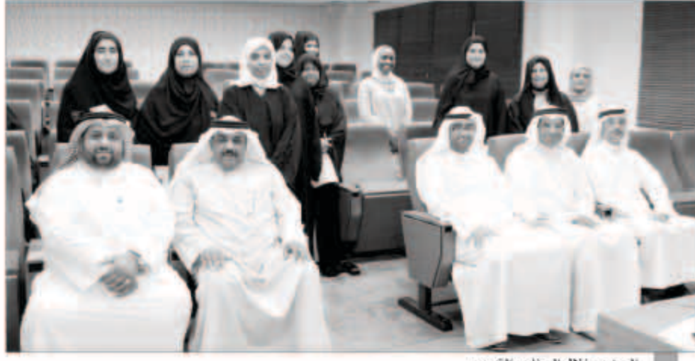
الحضور خلال البرنامج التدريبي

انشطة المركز التي يقيمها في كل عام، وذلك من أجل تطوير مستوى خريج كلية الهندسة والبتترول وصقله بالخبرات المناسبة التي تؤهله للعمل الجاد في سوق العمل وبالشكل الصحيح، متمنياً دوام التوفيق للجميع.