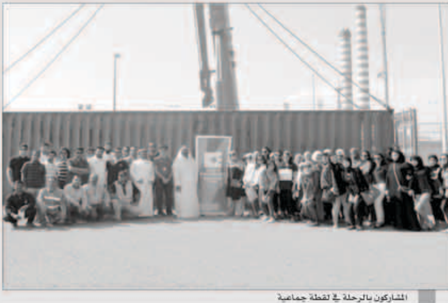
المشاركون بالرحلة في نقطة جماعية

قامت جمعية المهندسين الصناعيين «IIE» بتنظيم رحلة إلى رابطة الكويت والخليج للنقل KGL، حيث قام الطلبة بالتعرف على تفاصيل وخطوات كلا من خدمات التخزين والشحن والنقل البري والبحري داخل الكويت وخارجها.