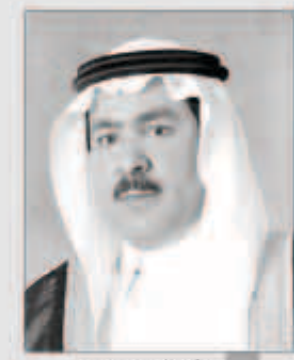
فيصل بن معمر

وأكد على أهمية الحوار بين أتباع الأديان والثقافات المختلفة لتعزيز الوسطية مشيراً إلى أنه في غياب التواصل والحوار والتفاهم بين الأمم ينشط المتطرفون في نشر الأفكار الهدامة.