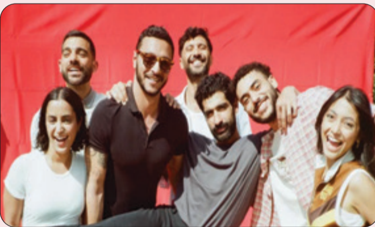
أبطال «جد جديد»

بمشاركة سوسن بدر ومي الغيطي بدء تصوير المسلسل الشبابي السعودي المصري «جد جديد» ويعرض قريبا