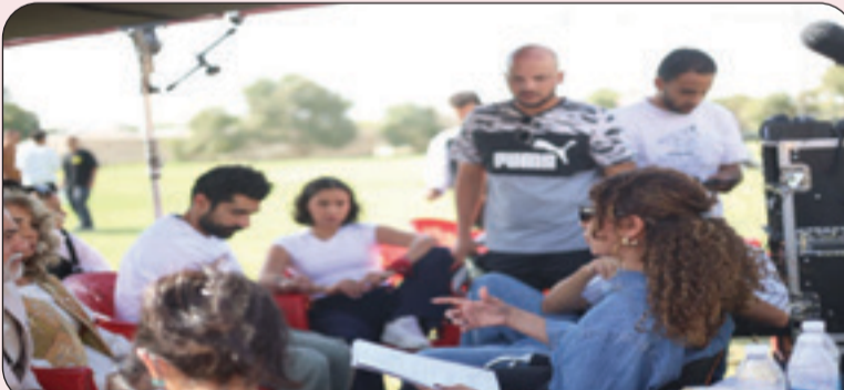
من كواليس التصوير