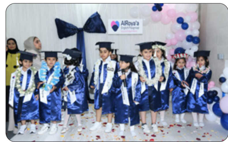
يوم كرنفالي في «الرؤية الإنجليزية»

نظمت حضارة الرؤية الإنجليزية يوما احتفاليا بهيجا بمناسبة تخرج دفعة جديدة من أطفالها، في أجواء مليئة بالفرح والفخر والحنين. انطلق الحفل بكلمة ترحيبية من إدارة الحضارة، عبرت فيها عن فخرها الكبير بأطفالها، الذين أتموا مرحلة الروضة بكل حب وتقدم، مشيدة بدور أولياء الأمور والعملات في دعم وتعزيز هذه الرحلة التعليمية الأولى في حياة الطفل. وقدم الأطفال مجموعة من الفقرات المبهجة، تنوعت بين الأناشيد، العروض المسرحية، والرقصات البسيطة التي نالت