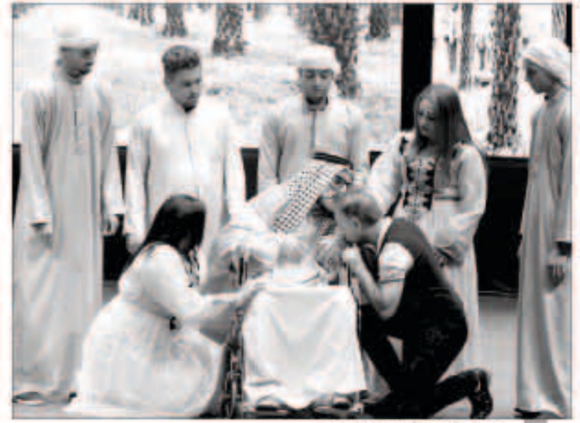
جانب من أوبريت أولاد العم العراقي