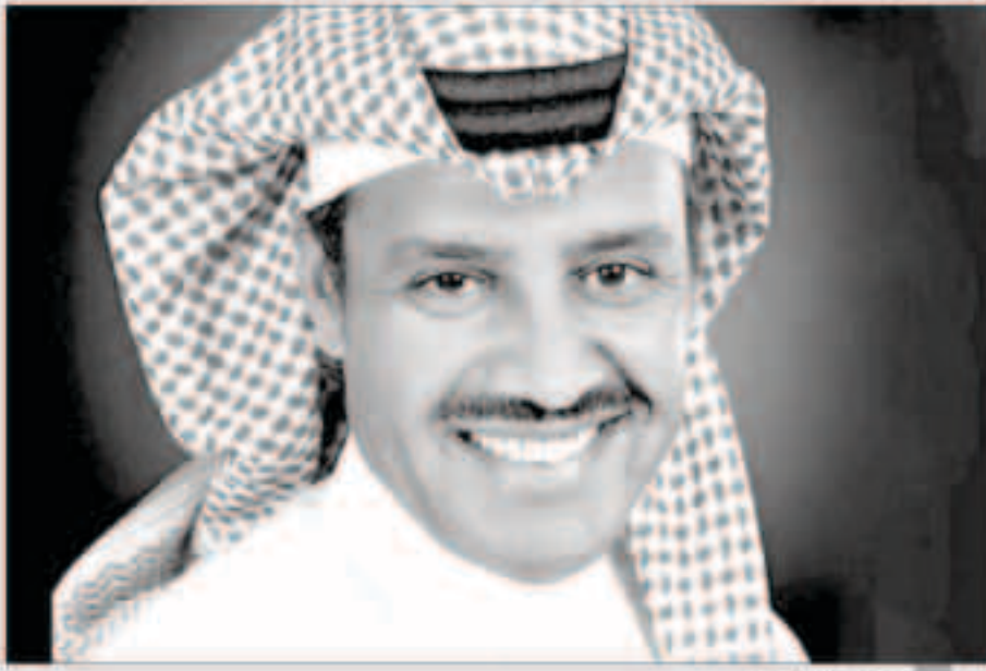
خالد عبد الرحمن

و«لبالينا»، كلمت قوس. تجدر الإشارة إلى أن شركة «روتانا» كانت قد شنت حملة واسعة ترافقت مع إطلاق الألبوم عبر صفحاتها على مواقع التواصل الاجتماعي.