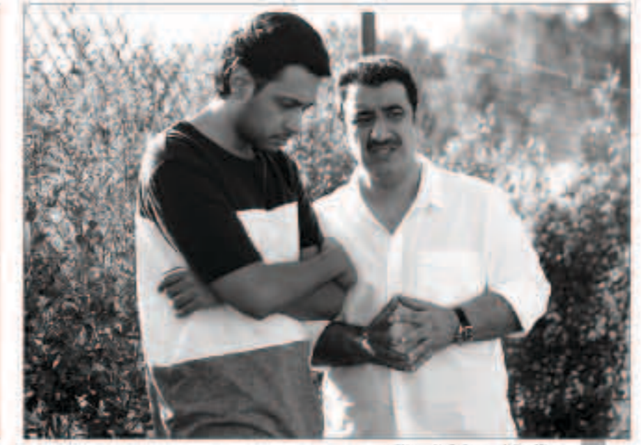
من الأسرة السعودية، البيت الكبير