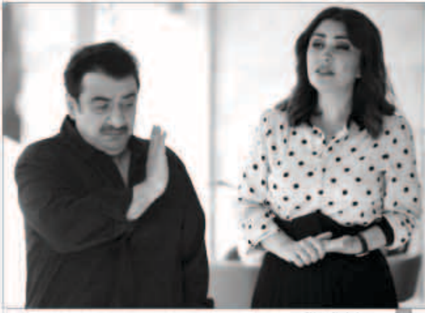
من مسلسل البيت الكبير

شور الكاميرا هذه الأيام في عدد من المدن التركية لتصوير أحدث المنتجات الدرامية التلفزيونية الجديدة بعنوان «البيت الكبير» والذي يمثل خطوة حقيقية جادة للعبور لشاهد التركي - والعربي على حد سواء. بمواصفات إنتاجية تأخذ بعين الاعتبار تقديم الدراما العربية للمشاهد بمواصفات تلبي بالمكانة التي راحت تحتلها اليوم الدراما العربية وثقله للوصول إلى المشاهد الخليجية الذي يبدو بعيدا بعض الشئ عن الدراما في العالم العربي. «البيت الكبير» هو مسلسل تركي عربي مشترك يضم ممثلين من عدة دول عربية بالإضافة إلى تركيا، ويتناول قصة كوميدية تعكس التقارب بين بين الشعوب، يتم ذلك من خلال أحداث مشوقة جاذبه تفر بكثير من الاحداث والمفاجآت التي تحبس الانفاس وتنطلق أحداث العمل من خلال رسالة فيديو يبشرها عبر (واتس اب) رجل تركي ثم تنتشر هذه الرسالة في أنحاء الوطن العربي كالنار في الهشيم وتصبح أحداث ضاحكه ومثيرة. ولما أن تسافر عبر تلك المفاجآت بحثا عن الحلم ولكن من قبلها التماس بين الشخصيات والثقافات والقيم في اجواء من الفرح والانطلاق والحيوية. وفي تصريح خاص أكد المنتج الفنان حسن عسيري على أهمية تجربة المسلسل الدرامي التلفزيوني الجديد «البيت الكبير» الذي يتواصل تصويره هذه الأيام في عدد من المدن التركية بوصفه مانه عمل يمثل نقلة في مسيرة الدراما التلفزيونية العربية والتركية، لقد انطلقت وأنا