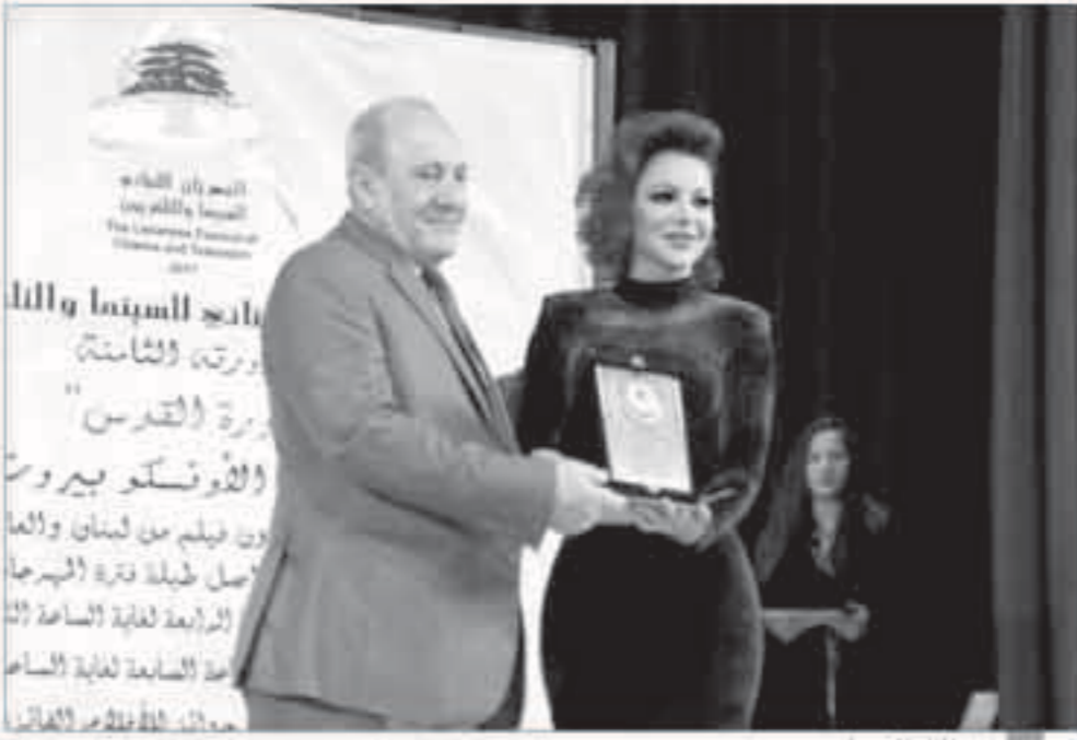
... واتناء تكريمها