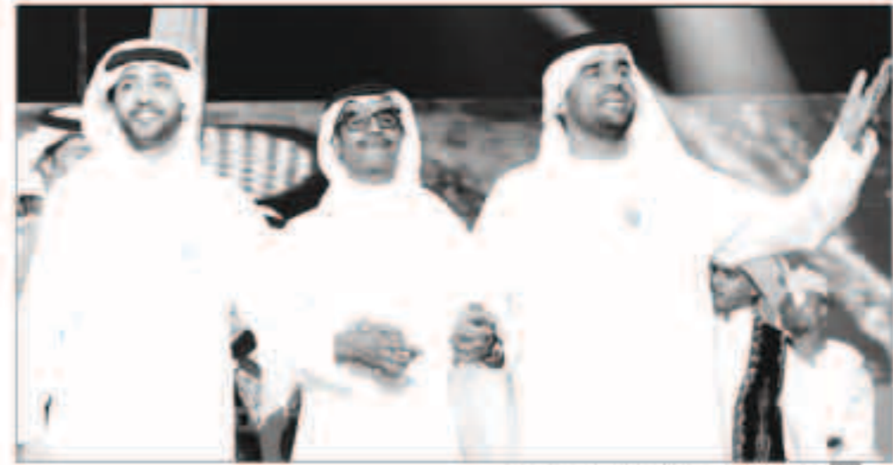
حسين الجسمي مع رابح صقر وفهد الكبيسي

بعد أن شارك قبل أيام قليلة في حفل افتتاح «خليجي 22»، وضمن فعاليات بطولة دورة الخليج لكرة القدم المقامة في العاصمة السعودية الرياض، سجل «السفير فوق العادة» للتواهي الحسنة، الفنان حسين الجسمي، مشاركته في حفل الثقافي الذي أقيم في مركز الملك فهد الثقافي في الرياض، وقدم برفقة الفنانين رابح صقر وفهد الكبيسي الأوبريت الغنائي الذي يحمل عنوان «خليجنا أحلى البلاد»، ويحاكي التلاحم الوطني الخليجي، وعمق التعاون الذي يجمع الشعوب بمحبة عابرة بين الدول، وذلك بحضور أمير منطقة الرياض تركي بن عبدالله بن عبدالعزيز وضيف الدورة من الأسراء والشيوخ والوزراء والسفراء وكافة رؤساء ووفود البعثات الرياضية والإعلامية