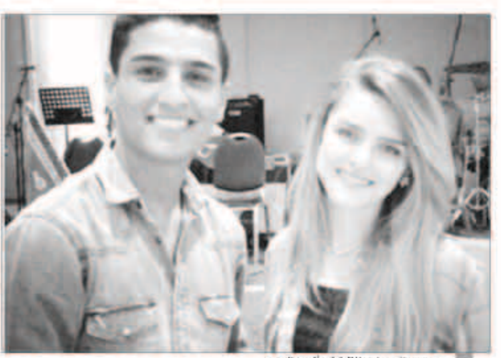
محمد عساف مع زين خلال توقيع اليوم الجديد

ترددت مؤخراً أنباء عن ارتباط الفنان محمد عساف، «محبوب العرب»، بفنانة من مدينة نابلس تدعى زين المصري، خريجة كلية الاقتصاد من جامعة النجاح الوطنية، وتناقلت صفحات مواقع التواصل الاجتماعي الخبر وسط ردود لعل متفاوتة من قبل محبي ومتابعي الفنان. في المقابل، أكدت الفنانة زين في تصريح لوكالة نعا أنها تفاجت من انتشار صورها واسمها في مواقع التواصل الاجتماعي ووسائل الإعلام تحت عنوان «خطبتها من الفنان عساف». لافتة إلى أن هذه الإشاعة سببت لها الإزعاج والإحراج. وفي التفاصيل التي رواها الشابة قالت: «محمد عساف كان يتحدث لجدي منيب في بيروت، أثناء مهرجان لإحياء ذكرى رحيل الشهيد ياسر عرفات عن إعجابي بي بعد أن تعرف علي لأول مرة في إحدى حفلاته الفنية بالأردن أثناء التقاط صورة معه كإحدى المعجبين بالفنان، فلم يشر إطلاقاً خلال حديثه مع جدي غرض موضوع الارتباط، ولكن صحفيين سمعوا الحديث الذي دار بينهما، وفسروه كما يحلو لهم ونشروه على أساس أن الفنان تقدم لطلب يدي من جدي وهذا الأمر لم يحدث». وفي تعليقه على ما أشيع عن زيارة محبوب العرب ووالدته لمنزل جدتها وطلب يدها، نفت زين صحة موضوع الزيارة، مؤكدة أن جدتها منيب سافر قبل عدة أيام - قبل انتشار الإشاعة - إلى روما ولم يعد حتى اللحظة، «فهل يعقل أن يقدم أحد لخطبتي دون الرجوع لجدي؟» من جانبته نفى محبوب العرب الإشاعة على حسابها على تويتر وفيسبوك وقال: «أحياناً وأغراضاً أشرككم على محبتكم ودعمكم وطهارة قلوبكم باختصار شديد عن إشاعة خطبتي (ليس هناك خطوبة وأنني بشكل قاطع بنسبة مئة في المئة هذا الخبر الكاذب، ولو في يوم ارتبطت ساعلت ذلك على الملأ)... وأضاف: «حسبي الله ونعم الوكيل في واتقوا الله في أعراض الناس».