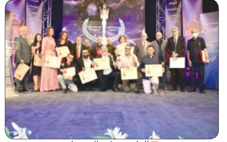
المكرمون في المهرجان

هشام صقر، وقد حصل على الجائزة الأولى فيلم «حظر تجول»، كما حصلت بطلة الفيلم الفنانة الإهام شاهين على جائزة أفضل ممثلة عن دورها فيه، بينما فاز كذلك الفنان خالد الصاوي بجائزة أفضل ممثل عن دوره في فيلم «صندوق الدنيا». المخرج أمير رمسيس حصل على جائزة أفضل مخرج عن فيلم «حظر تجول»، بينما فاز المخرج محمد جمال العدل بجائزة لجنة التحكيم الخاصة عن فيلمه «صاحب المقام» وفاز أيضا السيناريست يحيى فكري بجائزة أفضل سيناريو عن فيلم «يوم وليلة»، بينما ذهبت جائزة أفضل موسيقى تصويرية للموسيقار خالد الكمار عن فيلم «صاحب المقام».