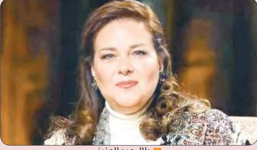
دلال عبد العزيز

فقط هو من يساند العائلة في هذه المحنة، ويريد من أمهات بشفاء الفنانة الكبيرة قريباً. وطلب من محبي دلال عبد العزيز الدعاء لها ولكل مريض بالشفاء العاجل، ما دفع الآلاف إلى التفاعل، متمنين لها الشفاء العاجل وتخطي تلك المحنة. وأشار إلى أن أسرة سمير غانم تعيش أوقاتاً عصيبة بعد رحيله، ومعاناة دلال عبد العزيز في المستشفى. فيما تحرص دنيا سمير غانم وشقيقتها إيمي على زيارة قبر والدهما بشكل أسبوعي، إلا أن كل واحدة تذهب مداورة على حدة، حتى لا يتركها بمفردها في المستشفى.