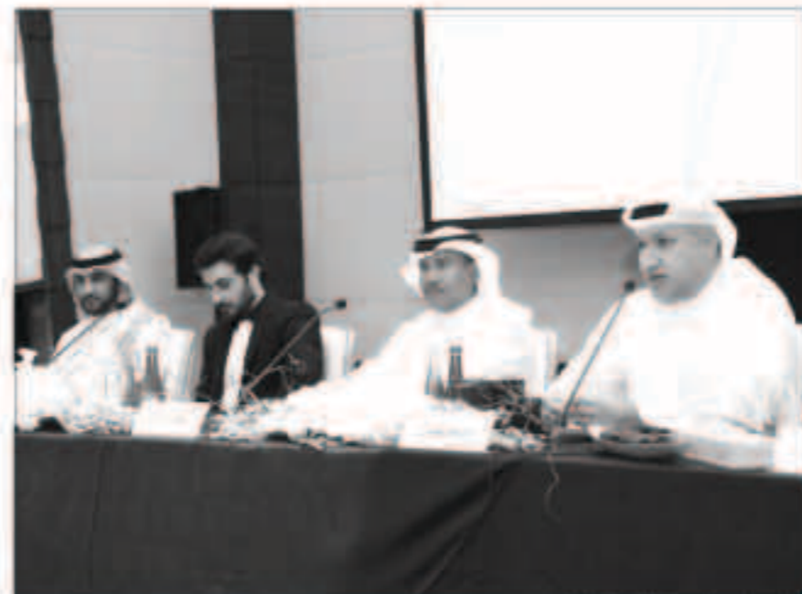
جانب من المؤتمر الصحافي