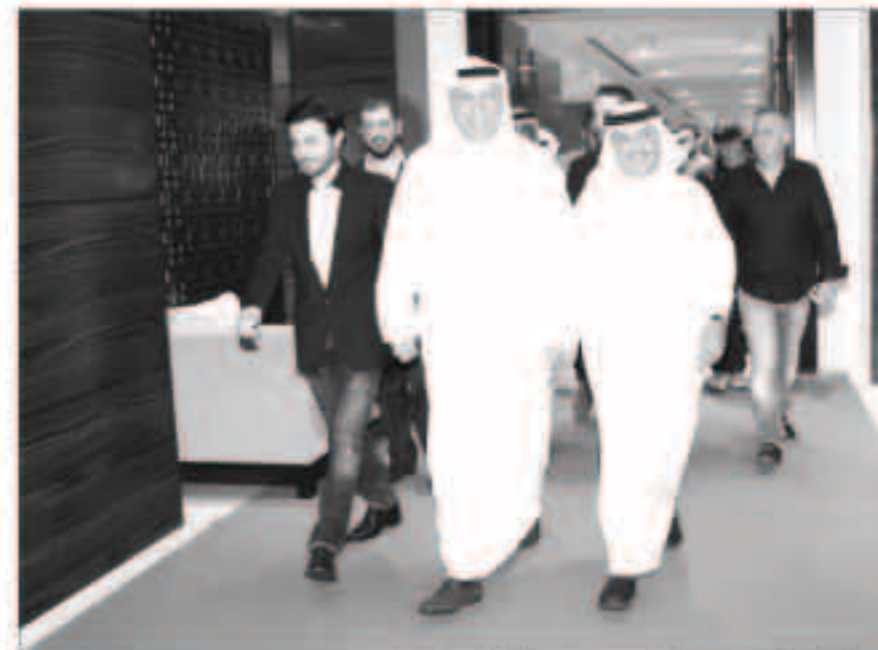
الهندي وعبدو والمهندس أثناء وصولهما إلى المؤتمر الصحافي

تخطي أغنية «نصفي الثاني» حاجز الثلاثة ملايين مشاهدة