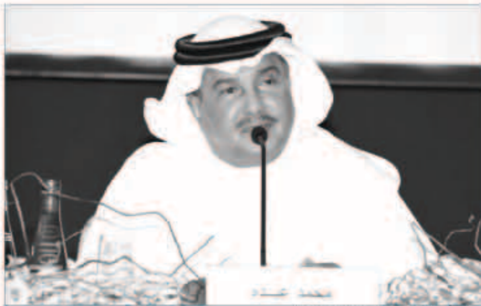
فنان العرب محمد عبده خلال المؤتمر الصحافي