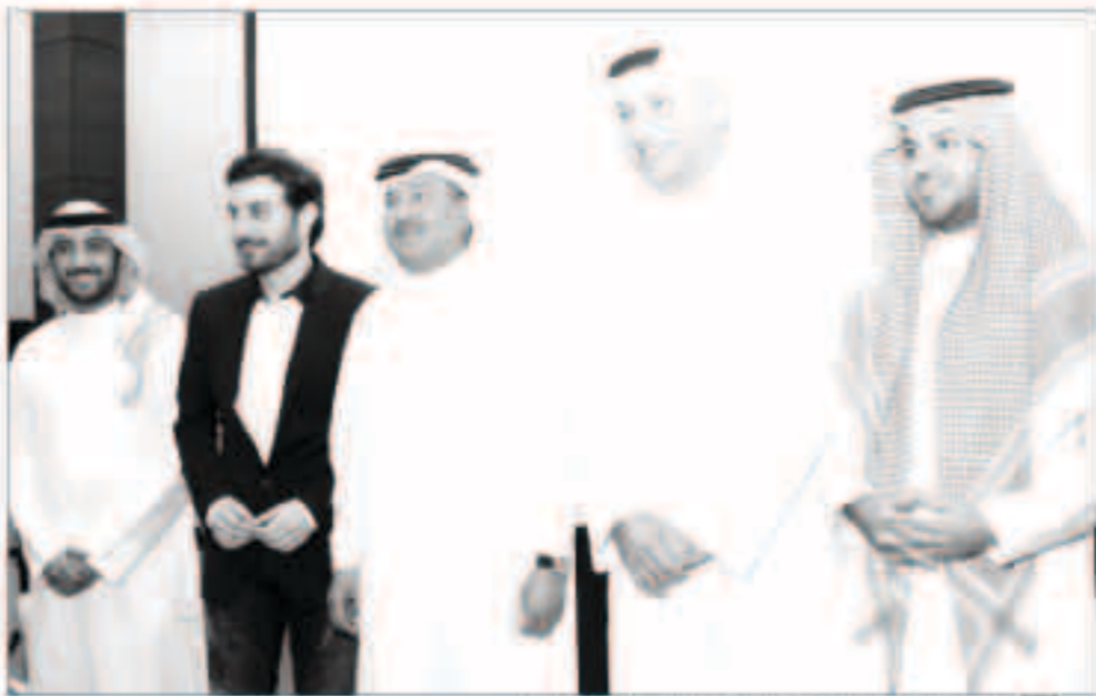
العراب سالم الهندي ومحمد عبده وماجد المهندس والمعلمة لتذكارية

وذكر الملحن محمد بودله أنه هذه الليلة «شعوري الليلة غريب» فسهيد بوجودي بين قاعدتين كبيرتين فتعاونت معهم هو أكبر إضافة وحافز لي وعن سؤال لفنان العرب عن لماذا لا يقدم الإيقاعات السعودية الأصيلة بشكل أكبر لجمهور الوطن العربي ذكر الفنان محمد أنه قدم جميع الألوان مثل السامري والمجروور والقصيمي والخيفي وكثير وقال كلما وقع بين يدي نص وعندما أشرع بتلحينه أجد أنني قدمته في السابق ومر علي قبل ذلك بالعكس أنا أعشق الألوان الشعبية كثيراً وقدمت على سبيل المثال «الحصر» بإصاح أنا قلبي من الحب مجروح» وأيضاً «ياشايين السامر» وغيرهما كثير جداً والنمى أن أوصل مسيرتي بالشعبي فأننا أحب الشعبي جداً وفي نهاية المؤتمر شكر الإعلامي على العلياني الصحافي على تواجدهم لتغطيتها مؤتمر فنان العرب والحرص على قامه ملك وفي النهاية أخذت عدسات للصورين صورة تذكارية لفنان العرب مع الأستاذ سالم الهندي والنجم ماجد المهندس والملحن محمد بودله وسط تصفيق من الحضور