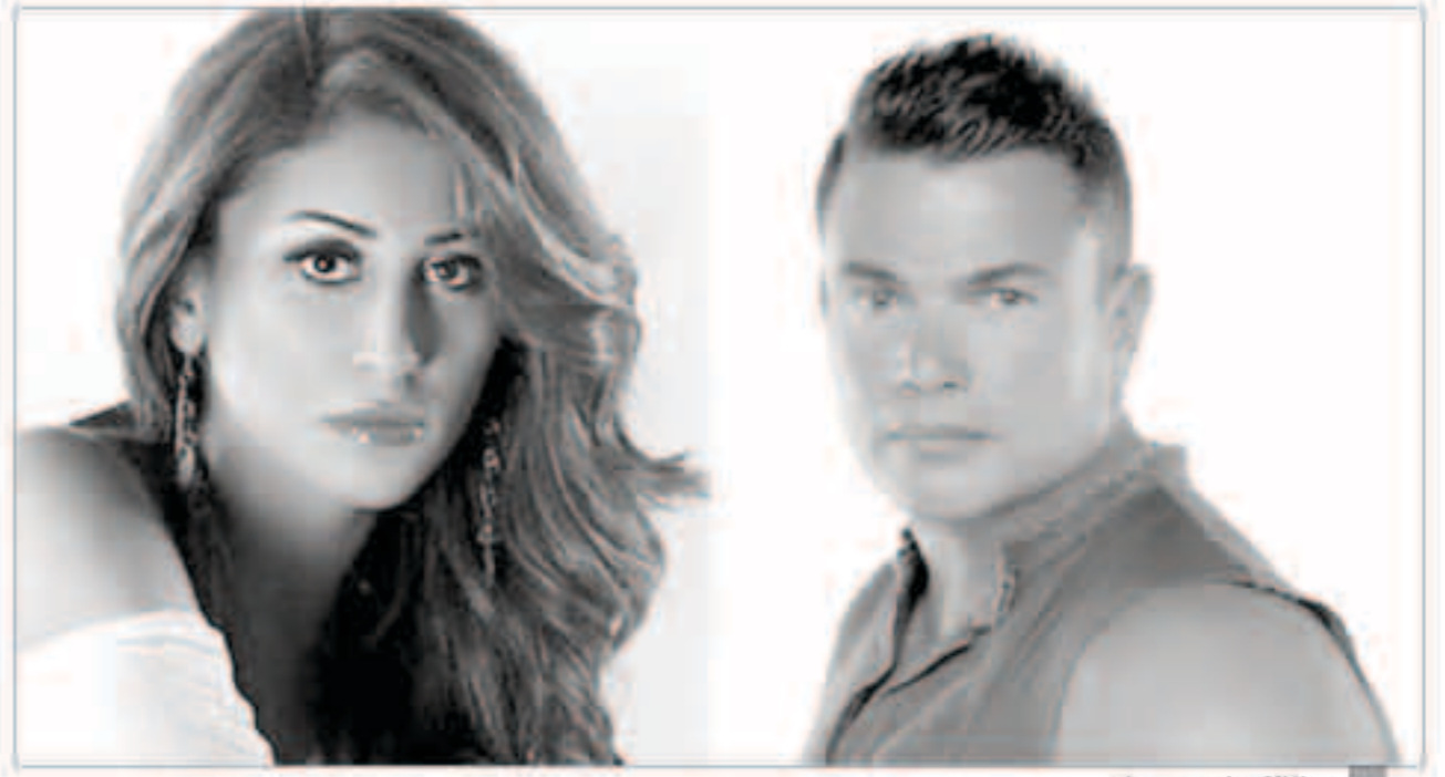
دينا الشربيني وعمرو دياب

يبدو أن العلاقة بين الفنان عمرو دياب والفنانة دينا الشربيني لن تتوقف عن إثارة الجدل وستبقى محط إهتمام وسائل الإعلام على الرغم من تفهيمها أكثر من مرة ما يتردد عن زواجهما سرا. فقدارت الشربيني برفقة دياب على متن طائرة خاصة متوجهين إلى العاصمة البريطانية لندن حيث كانت الفنانة الشاببة هي السيدة الوحيدة على متن الطائرة التي استقبلها المطرب المصري الشهير. ورغم إعلان الممثلة المصرية أن ما يربطها بالمغني المعروف في الفترة الحالية هو التخصيص لفيلمها الجديد «الشهرة» المقرر انطلاق تصويره في الأسابيع المقبلة، إلا أنها رافقتة خلال الحفلات الثلاثة التي قام بإحيائها في الساحل الشمالي والغردقة خلال الأسابيع الماضية، كما تواجبت برفقته خلال احتفالات عيد الأضحى. وسبق لها أن سافرت قبل ذلك برفقة دياب على متن طائرة خاصة إلى الإمارات، كما اعتادت الظهور برفقته في عدد من الأماكن العامة.