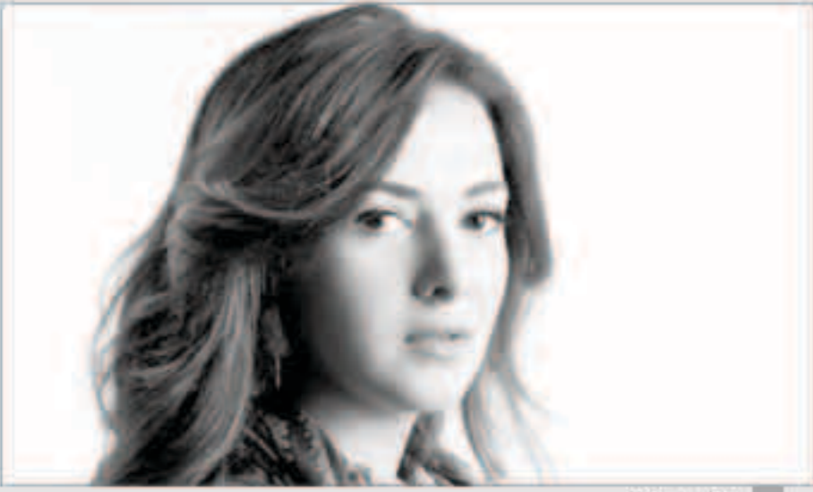
دنيا سمير غانم

تغيب الفنانة دنيا سمير غانم درامياً خلال الموسم الرمضاني المقبل لأول مرة منذ سنوات بعدما قررت التركيز بعشر وعاشرة الفنانة والتخصيص لسلسلة درامي يعرض في رمضان 2019. وستتلقى الفنانة الشاببة بالتركيز في الغناء ويمشراح سينمائية مرشحة للإشتراك في بطولتها خلال الشهور المقبلة، حيث تسعى للعودة على فكرة برامية جيدة تقوم بالتخصيص المناسب لها قبل التصوير حتى تجد رة فعل جيد مع الجمهور لاسيما بعدما لم تحقق تجربتها الأخيرة «في اللا لاند» النجاح المطلوب جماهيرياً. غانم أبلغت أصدقائها وشركة روزمانا التي تتعاون معها لكي تخرج من حسابات المنافسة على شراء حقوق العرض بين المحطات التلفزيونية التي بدأ الفنانون عليها بالتخصيص لخريضة العرض لرمضان المقبل.