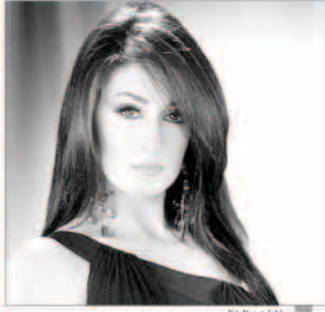
غادة عبد الرزاق