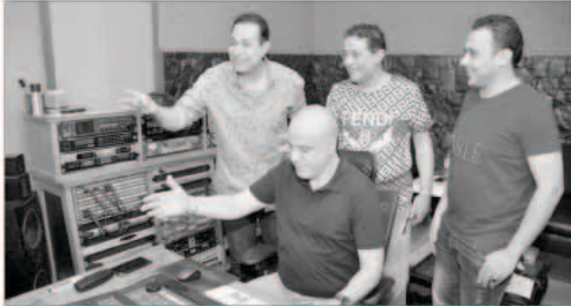
حكيم في الاستوديو

حالة من النشاط الفني يعيشها الفنان حكيم حيث استقر على تصوير ثلاثة كليبات خلال الفترة القادمة لتكون جاهزة للعرض في موسم الصيف والأغنيات توزع للفنانين اسلام شيمسي وميدو مزيكا اللذان يواصلان التعاون مع الفنان الشعبي بعد أغنيات «عم سلامة» و«علي وضعك وابو الرجولة» بعد أن صبحت تربطهما بحكيم كميماء خاصة في التعامل بحسب بيان صحفي صدر عن المكتب الاعلامي لحكيم وجاء فيه أن الأغنيات الثلاث من المقرر أن يتم تصويرها تحت إشراف للمنتج الفني فايز عزيز. الأغنية الأولى بعنوان «حب الناس» والثانية «سبونًا في حالنا» والأغنية كلمات عصام حجاج والحان ناصر حجاج. أما الثالثة «ماشي عيش خصام» كلمات أمل الطاهر الذي قدم ما يقرب من نصف أعمال حكيم ورفيق رحلة نجاحه الفنية والحان وحيد المليجي. وقد احتوى البيان على صور خاصة لحكيم من داخل استوديو تسجيل الأغاني وبدا حكيم فيها وهو يتعامل بعفوية شديدة مع فريق العمل ويحتسي الشاي أثناء عمله على الأغاني حيث استمر تواجدهم في الاستوديو لعدد ساعات طويلة من الأجل الانتهاء من الأغنيات الثلاثة في نفس اليوم.