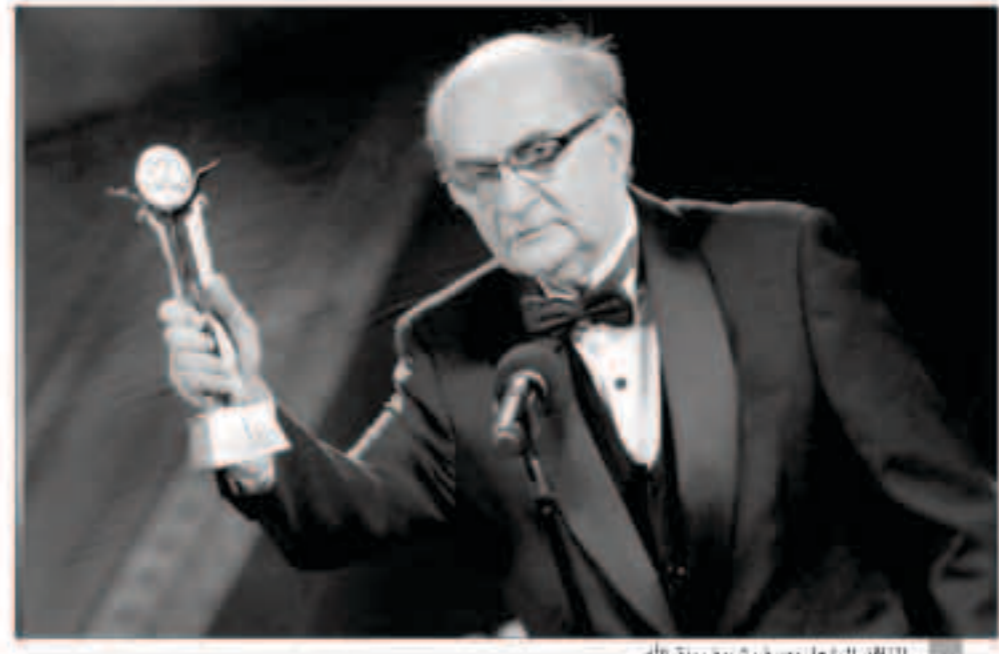
الناقد الراحل يوسف شريف رزق الله

وأضاف أن أسرة رزق الله تشعر بالامتنان والسعادة تجاه قرار إدارة المهرجان بإطلاق اسم والده على الدورة الحادية والأربعين.