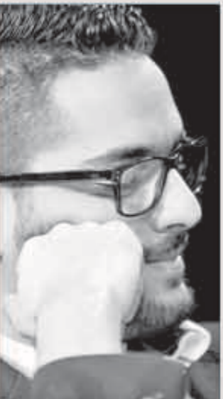
غفوة حسن الشافعي تثير إعجاب متابعيه

أكثر من 40 ألفاً من متابعي صفحة الموسيقى حسن الشافعي على موقع التواصل الاجتماعي الفيس بوك تضم أكثر من مليوني و300 ألف متابع. إضافة إلى آلاف من الفانز على صفحته على تويتر أعربوا عن إعجابهم بصورة الموسيقى التي نشرت على صفحته الخاصة هذه. وحيث يظهر الشافعي وهو نائم أثناء العمل. وكان انجز الشافعي توزيع أغنية جديدة بعنوان «مديونتك» للفنان فيم شاكير سبقتها في اليوم الجديد «أحلى قرار» الشهر المقبل.