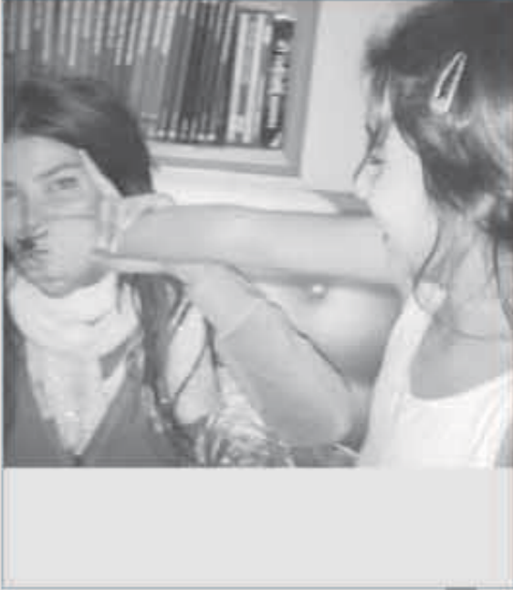
مي حريري مع ابنتها