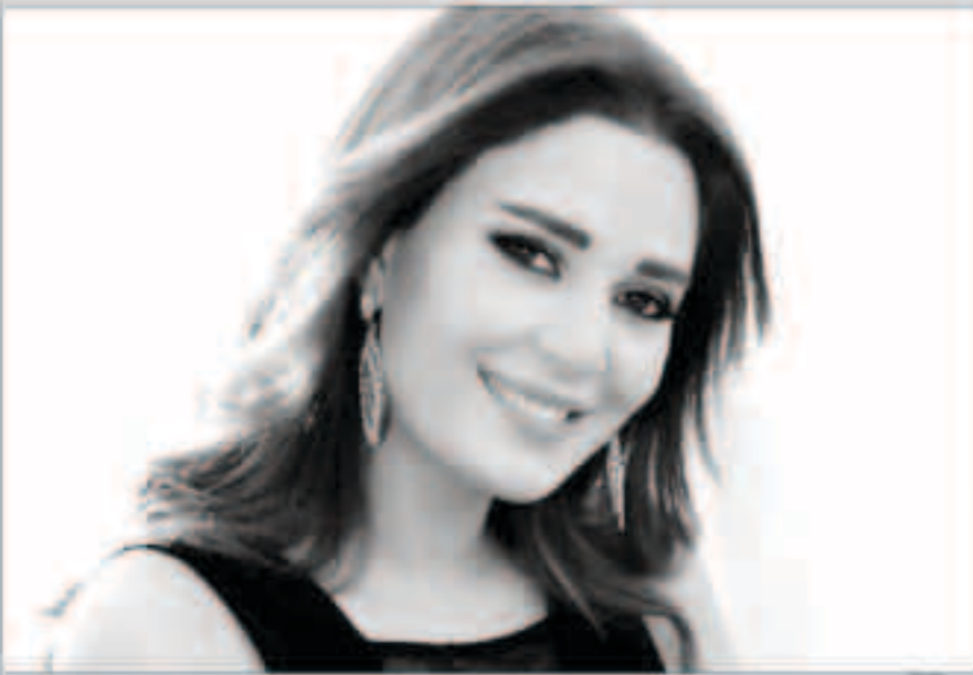
سيرين عبد النور