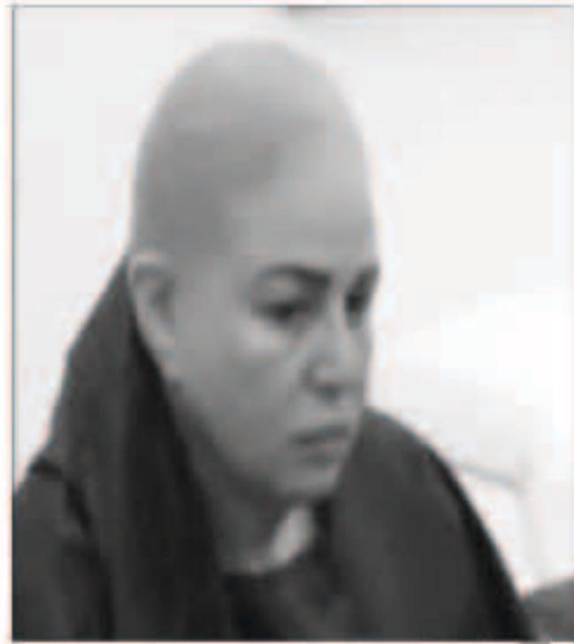
إلهام بدون شعر

والفنانة التونسية «ساشي» يذكر «محمد السبكي»، في ذكرى أن المخرج محمد سامي استعان بإلهام شاهين بعد اعتذار الفنانة يسرا عن المشاركة في الفيلم الدولي في دورته الـ36.