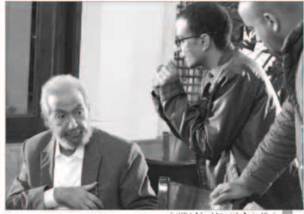
نور الشريف في مشهد من فيلم «بتوايت القاهرة».

ويتناول العمل الذي يخرج به إبراهيم البطوط، قصة الفط الذي يقوم بتطبيق زوجته ويترك عائته بعد اختفائه ليلته دون أن يعلم صبرها، ولكنه يحاول بعد ذلك البحث عنها بعدما علم بأن هناك عصابة تستهدف خلفه.