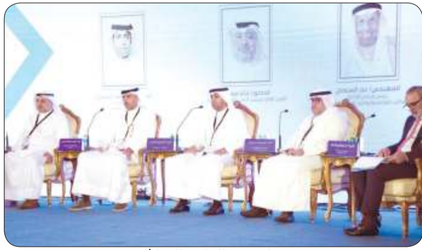
جانب من الحلقة النقاشية

المشاريع التنموية الكبرى من خلال تسهيلات نقدية أو غير نقدية، بفضل ما يتمتع به من خبرات وملاءة مالية وقدرات انتمائية عالية ومزايا تنافسية متنوعة كالانتشار الواسع في 12 دولة حول العالم، وتصدره كل الشركات الكويتية المدرجة في بورصة الكويت من حيث القيمة السوقية والتي تبلغ نحو 41 مليار دولار، ومعدلات الربحية الأعلى على مستوى القطاع المصرفي، والقاعدة الرأسمالية المتينة ونسب السيولة العالية التي تمنح «بيتك» قدرة انتمائية عالية لتمويل مشاريع عملاقة في البنية التحتية والمشاريع النفطية، والمشاركة في قيادة صفقات تمويلية ضخمة.