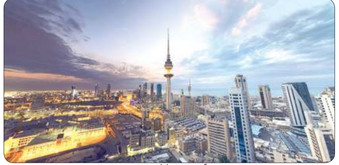
الكويت تتقدّم على مؤشر التنافسية العالمي

تقدّمت الكويت مرتبة واحدة في تقرير الكتاب السنوي للتنافسية العالمية، الصادر عن مركز التنافسية العالمي التابع للمعهد الدولي للتنمية الإدارية (IMD)، حيث حققت المركز 37 عالمياً من أصل 67 دولة هي الأكثر تنافسية في العالم. وجاءت الكويت في المركز الخامس عربياً في الترتيب العام لمؤشر التنافسية 2024، بعد الإمارات التي تصدرت القائمة عربياً، وجاءت 7 عالمياً، ثم قطر بالمرتبة الثانية والـ11 عالمياً، فالسعودية بالمركز الثالث والـ16 عالمياً، ثم البحرين بالمرتبة 21 على المستوى العالمي.