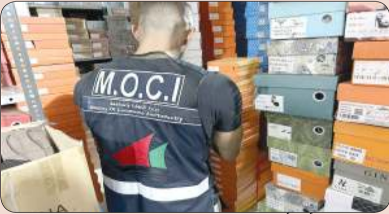
أحد أعضاء فرق التفتيش خلال عملية الضبط

أعلنت وزارة التجارة والصناعة أن فرق الرقابة التجارية والتفتيش قاموا بضغط 623,762 ألف قطعة من البضائع المقلدة الفاخرة بدرجة عالية من العلامات التجارية العالمية المشهورة بقيمة تفوق الـ10 ملايين دينار كويتي «حالي 33 مليون دولار أمريكي». وقالت الوزارة في بيان صحفي أن هذه الضبطية تعتبر واحدة من أكبر الضبطيات على مستوى الوزارة في الكويت والتي تم ضبطها في أحد المخازن بمحافظة الفروانية وتتنوع بين اكسسوارات وحقائب وملابس نسائية وأحذية وغيرها. ونقل البيان عن وزير التجارة والصناعة ووزير الدولة لشؤون الاتصالات عمر العمر تأكيداً على الالتزام بتطوير منظومة التفتيش والرقابة التجارية بالوزارة للحفاظ على استقرار السوق وتطويره وضمان حماية المستهلكين من أي تجاوزات. وشدد العمر على مواصلة العمل الدؤوب لتقديم الدعم الكامل للكوادر الوطنية وتعزيز قدراتها لضمان بيئة تجارية آمنة مزدهرة للجميع مشيداً