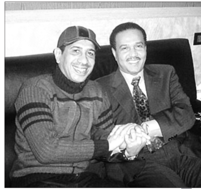
الصالح وصداقة قوية مع فنان العرب