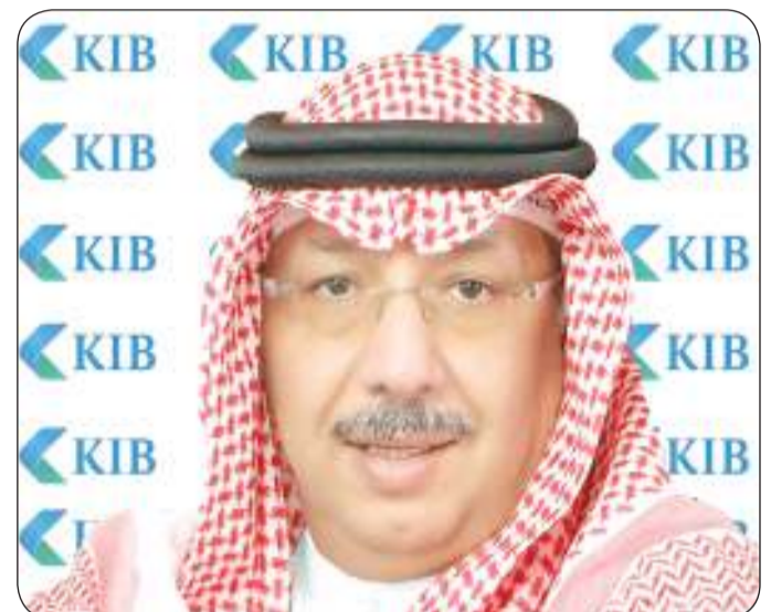
الشيخ محمد جراح الصباح

التحتية التكنولوجية والتحول الرقمي وزيادة حصته في السوق. وسيستمر KIB بإتمام كافة الإجراءات المتعلقة بعملية إصدار الأسهم والإعلان عن مواعيد الاستحقاقات واستكمال الحصول على الموافقات الرقابية اللازمة والجاري الإعلان عنها عبر منصة بورصة الكويت.