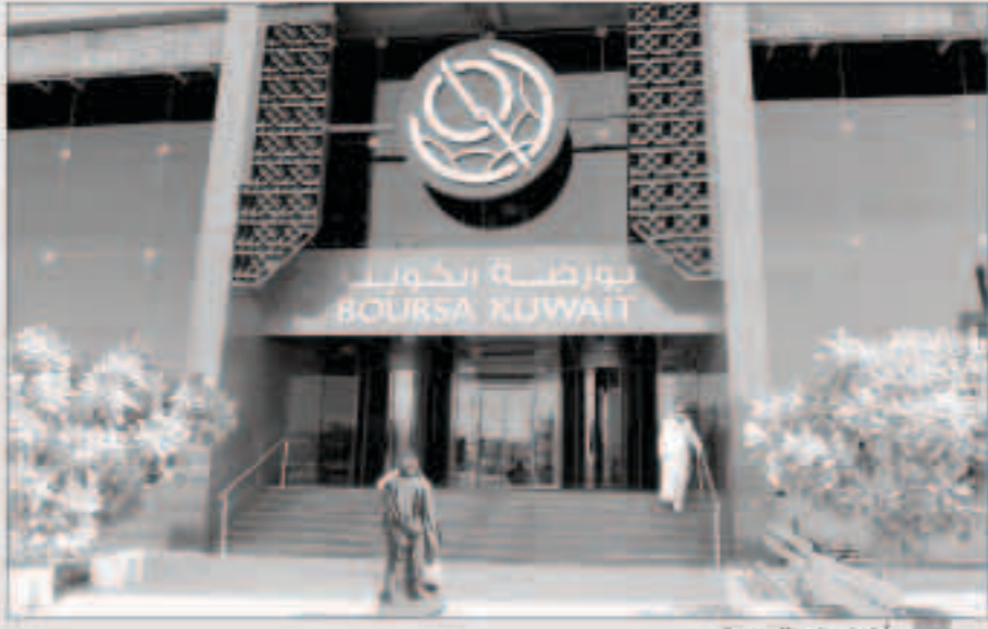
أداء إيجابي للبورصة

انتهى المؤشر العام لبورصة الكويت تعاملات جلسة أمس الأربعاء في المنطقة الخضراء بعد ونسبة سادها الربح للمعاملات الفصلية للمصارف والتفاعل مع سهم شركة (زين) تزامنا مع الكشف عن أرباح (زين السعودية). وبلغت هذه النتائج على سهم الشركة التي تقدر أرباحها بـ 45 مليون ريال (نحو 12 مليون دولار أمريكي) في الربع الأول من العام الجاري حالة من الإيجابية في بورصة الكويت من خلال 136 صفقة تمت عبر 4,8 مليون سهم بقيمة فاقت 2,2 مليون دينار (نحو 7,19 مليون دولار). وانعكست هذه الحالة إيجابيا على بعض أسهم قطاع الاتصالات من حيث النشاط من جانب المتعاملين المهتمين بأسهم هذه الشركة من الشركات. وكان لافتا في الجلسة التي أسدل على ثنائين في مؤشراتها الرئيسية استمرار حالات المضاربات التي طاولت الكثير من الشركات القيادية التي كان جزءا كبيرا منها متماسكا في حين ثابته بعض الأسهم الرخصه اهتمام المتعاملين الأفراد والمحافظة المالية على حد سواء. كما كان واضحا تراجع بعض أسهم القطاع المصرفي وعودة الزخم على سهم شركة (هيومن سوفت) المبرج في قطاع الصناعة والتي حظيت