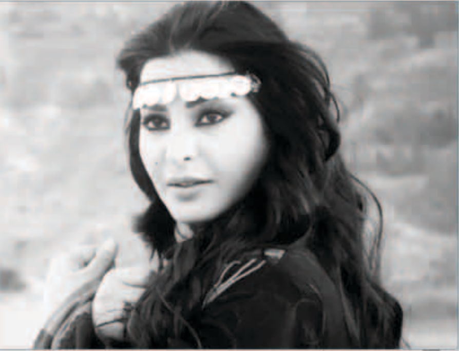
لولة، بدوي لريم عبدالله

صورة لريم نشرت على حسابها بموقع «انستغرام» ظهرت فيها بـ «لوك» بدوي، خلال تصويرها للمسلسل البدوي الأردني «رعود المنزل»، حيث وصف تلك الصورة بأنها تجسد جمال النجمة السعودية.