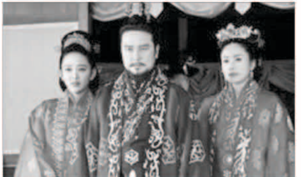
الدراما الكورية بدأت تأخذ طريقها نحو العرب

بدأت شاشة «MBC ACTION» يعرض الدراما الكورية التاريخية المبدجة إلى العربية «صراع الملوك». تدور أحداث المسلسل حول الملك الشاب والطموح غيون شوغو، الذي دام فترة حكمه من 346 إلى 375م. ومع التوسع الذي راح تشهد حدود مملكة غيون شوغو، الذي عرف بالملك المحارب، توالى المؤامرات والدسائس ضده، وهو ما تسلط عليه أحداث العمل الضوء، في سياق حبكة درامية متصاعدة تمتد على مدى نحو 80 حلقة. وفي حبكة بلغت فيها انتصارات غيون شوغو اقاصي كوريا باسطة سيطرته على الجزء الأكبر من أراضيها، تمكن الملك المحارب من إخضاع جميع خصومه بحد السيف تارة، وبالدهاء طوراً، فيما تجاوز النفوذ السياسي لمملكته حدود شبه الجزيرة الكورية ليلبغ الصين.