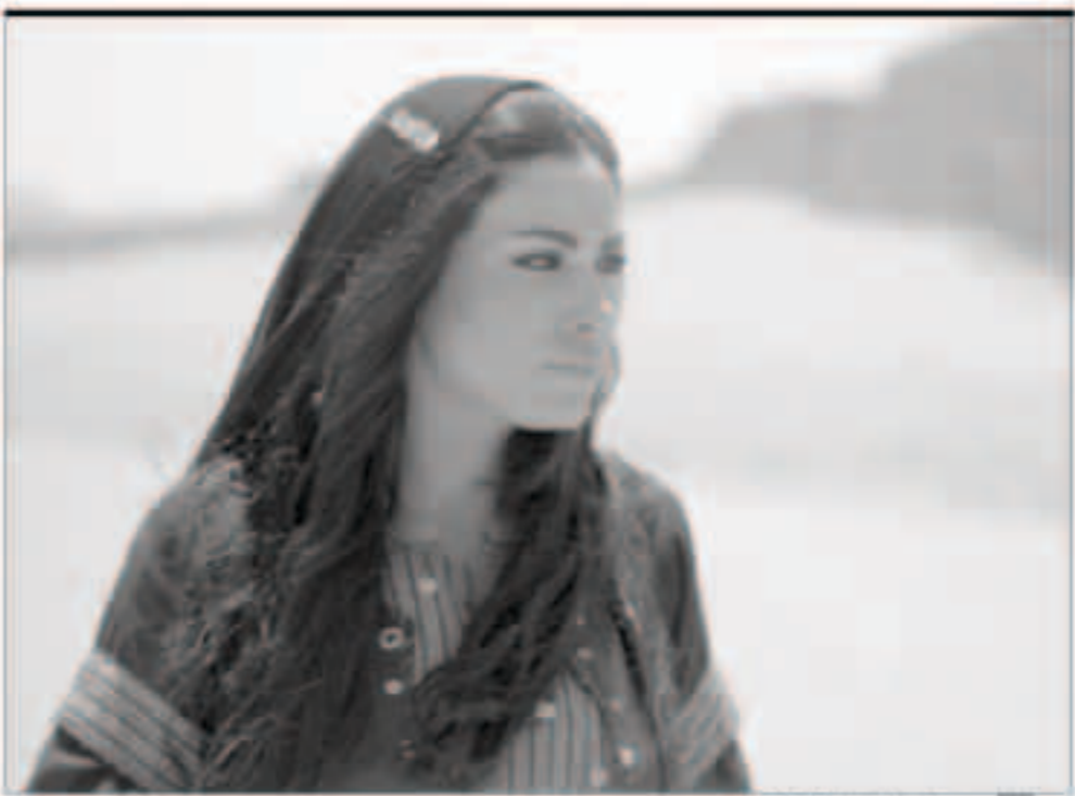
صبا مبارك في طوق الأسفلت

ساقه، الأمر الذي يضعف الشيخ الذي لم يعد شاباً، وتعمقه الإصابات عن بسط ثوبه على عشيروته والعشائر المجاورة، وتبرز قضية ثامن من سيخلفه، فسله «مسوم» كما تندر بالقول بعض نساء المنطقة إذ ولد ابنه الأول ميتاً، والثاني مات بعد أيام، بينما ولد الثالث، «نصيب» مشلولاً، أما طراد، ابنه الأصغر، فكان يقبل أمه ليلة انخاض وللنصدي لـ «عجاج» فارس العشيرو، يدرك مزلع أن عليه تحطى ابنه الأكبر «نصيب» بسبب شلله، وتتهيأ الأصغر «طراد» لتولي قيادة العشيرة من بعده، وإلا، ستخسر عائلته مكانتها، ومع ضعف مزلع، تتح الماه، ويقرب من ربوع القبيلة مسرور شق طريقه خارجي، وعمله والياته. من الناحية الفنية، تم تصوير مشاهد عديدة من المسلسل بطريقة الكاميرا المحمولة، كون القصة فيها الكثير من الحفايا والمفاجآت، مما يساعد على إضفاء الواقعية وخلق صورة مختلفة عن باقي المسلسلات البدوية، وإضافة لغة سينمائية شعرية لتناغم مع ملحمة القصة.