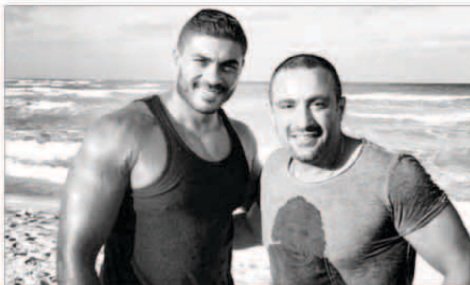
... ومع أحمد السقا على الشاطئ

قام الفنان خالد سليم بنشر، على حسابه الخاص في موقع التواصل الاجتماعي «انستغرام»، صورة له مع الفنان أحمد السقا أثناء قضاتهما إجازة في الساحل الشمالي. من المعروف عن سليم والسقا عشقهما لممارسة الرياضة وكلاهما يتمتع بجسد رياضي يحاول استعراضه في أي مناسبة