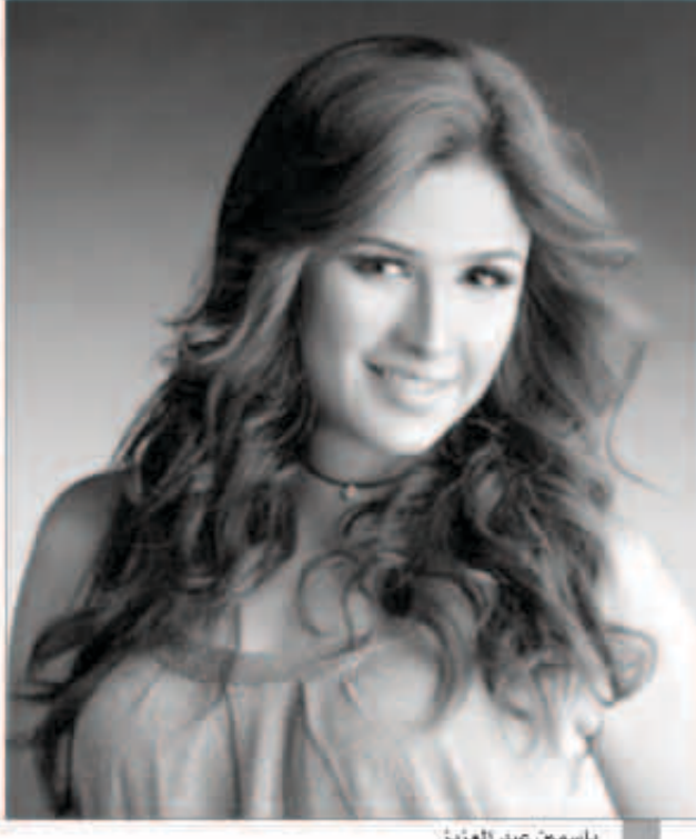
ياسمين عبد العزيز