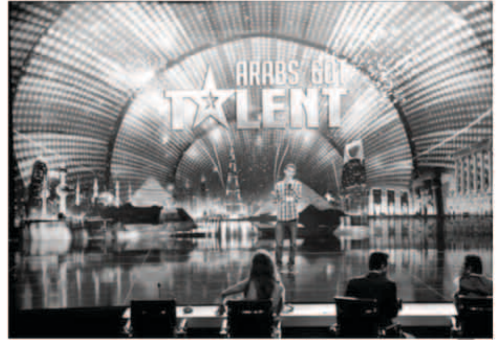
إصرار أمين خلف على الغناء دفع اللجنة إلى السخرية منه