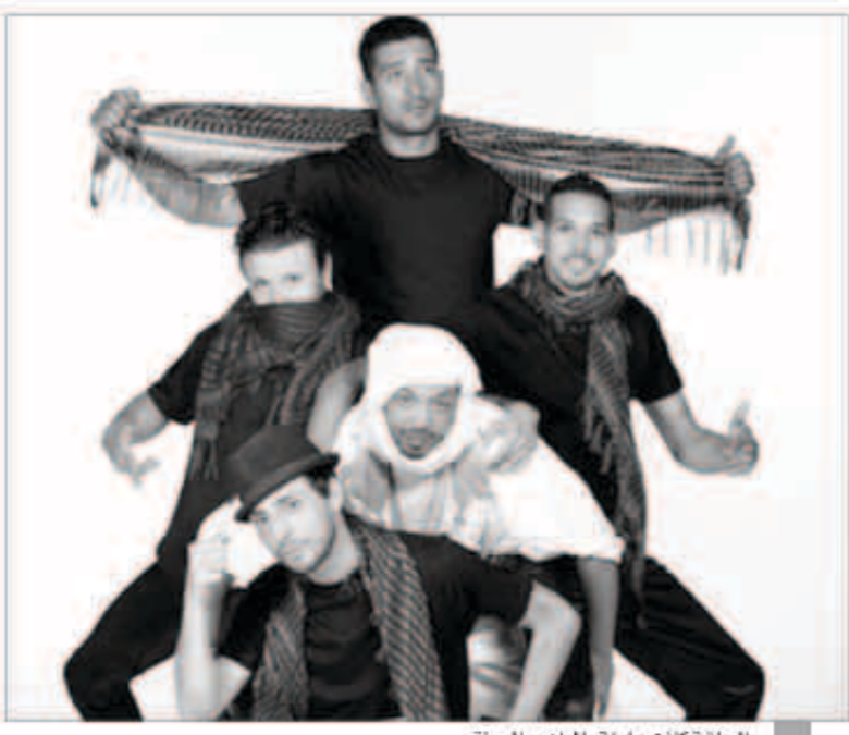
الحلقة كانت مليئة بالمواهب المميّزة

قدمت أغنية «زي العسل» للشحورة صباح، وبسبب أدائه السيمى رفضته اللجنة، لكن إصراره على الغناء دفع أحمد وناصر إلى السخرية منه، ما جعل نجوى تنصحه بالابتعاد عن تلك المهزلة، لكن إصراره على تقديم مواهب أخرى دفع باللجنة لإعطائه فرصة ثانية للتمثيل، ولكن العرض الثاني لم يكن أفضل من الأول، وكان أشبه بوضلة من الضحك المائل إلى السخرية لدرجة أن أحمد حلمي قال له: «قد لا تصبح فناناً ولكنك ستصبح منذ اليوم نجماً على يوتيوب»، وفي هذا الأثناء كان علي جابر قد وصل وشاهد أداء أمين.