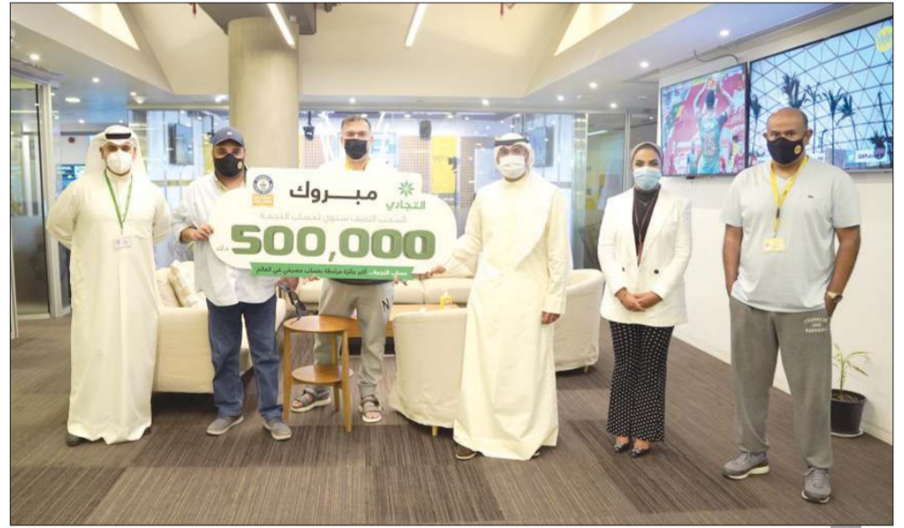
ممثلو البنك التجاري مع أسرة برنامج ديوانية الياقوت والانصاري

المزايا المتطورة التي تحملها البطاقة كي نت تتناسب مع نمط الحياة والاحتياجات المصرفية للعملاء وتأتي هذه الخطوة في إطار حرصه الدائم على تقديم أفضل مستوى خدمة وأكثرها أماناً لراحة عملائه أثناء تسوقهم عبر المواقع التجارية العالمية. والبنك تجاري يدعو جميع عملائه إلى الدخول على صفحة البنك على الإنترنت وصفحات التجاري على جميع مواقع التواصل الاجتماعي، والتعرف على الجوائز التي توفرها هذه حملات وبرامج البنك التسويقية، والحصول على معلومات إضافية بالاطلاع على أحدث المعلومات عن منتجات التجاري المصرفية والعروض المصممة خصيصاً لتلبية كل احتياجات العملاء عبر خدمة العملاء على الرقم 1888225 أو عبر التجاري وياك واتساب) 50888225 أو عن خدمة الفيديو المباشر أو خدمة المحادثة الفورية عبر الموقع WWW.CBK.COM أو تطبيق التجاري موبايل. وفي الختام، توجه البنك التجاري الكويتي بالشكر الجزيل إلى أسرة الأعداد والتقديم في برنامج «ديوانية الياقوت والانصاري» على حسن الاستضافة وتعاونهم مع البنك.