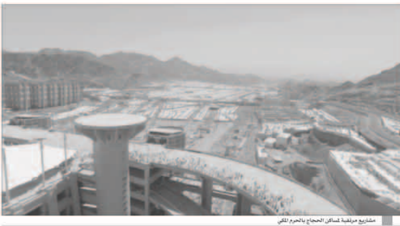
مشايخ مملكة مسكن الحجاج بالحرم المكي

خطه تطوير المشاعر المقدسة ضمن مخطط مكة الجديد، وتعتمد خطة التطوير على إعادة النظر في هيكلة أنظمة السكن والنقل وخدمات النقل، وستنضم ست مناطق لكل منها خدمات نقل وتغذية وسلامة ونظافة منفصلة، وسيتم تنفيذ خطة تطوير المشاعر المقدسة على مراحل حتى لا تتأثر استمرارية