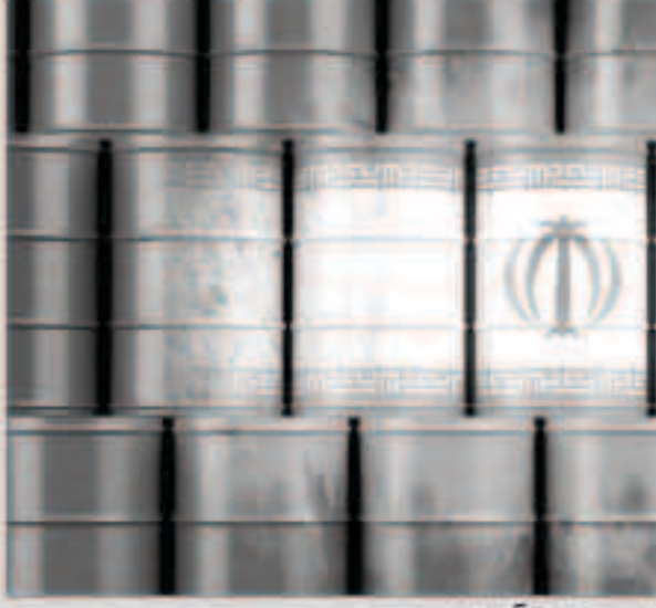
صادرات إيران النفطية تقفز لأعلى مستوى في 5 سنوات

قال مصدر مطلع على جدول تحميل ناقلات النفط في إيران إن صادرات البلاد من الخام في أغسطس فزت 15% من مستواها في يوليو. لتزيد على مليوني برميل يوميا، وتقرب من مستوياتها قبل فرض العقوبات على طهران.