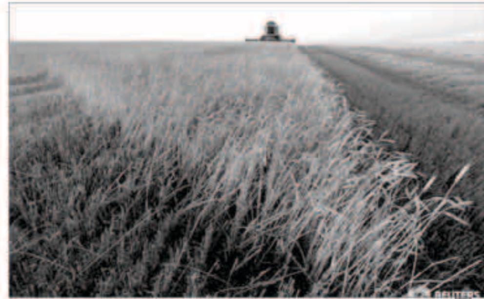
صورة لقطار القمح في أحد الحقول بالقرب من مدينة كراستويارسك، بسيبيريا في روسيا

المملكة العربية السعودية. وأضاف أنه من المفترض أن يبدأ الموسم أوائل أكتوبر وجميع الشركات مرتبطة بعقود كبيرة مع مزارعين مصريين. هذا النطاق الزمني الضيق لن يسمح لنا بطرح أسواق أخرى».