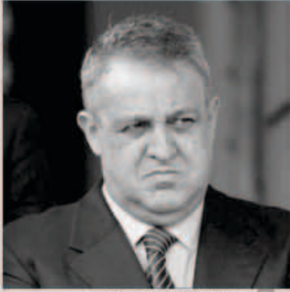
وزير النفط القنزويبي يزور لوجيو ديل بينو

قال وزير النفط القنزويبي إيلوخيو ديل بينو إن بلاده ستستغل قمة حركة عدم الانحياز التي ستعقد هذا الأسبوع للاجتماع مع منتجي النفط وحشد التأييد لاتفاق عالمي لتعزيز أسعار الخام في اجتماع مقرر بالجزائر هذا الشهر.