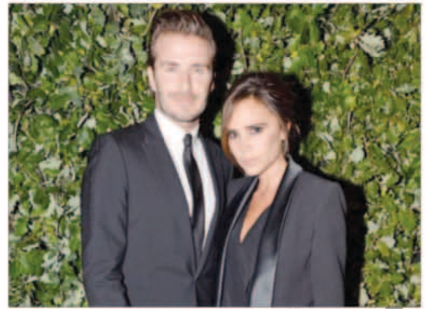
ديفيد بيكهام و فيكتوريا

فيما يعيش اللاعب سامي خضيرة قصة حب مع عارضة الأزياء الألمانية «ليندا جيرك» إذ أثارته هذه القصة جدلاً