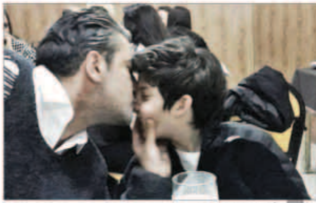
أركان بتكيا يقبل ابنه

علاقة مميزة جداً تجمع بين النجم التركي أركان بتكيا الشهير بـ«القبطان علي» وابنه «كانون»، وهذا ما تظهره الصور التي دائماً ما يشارك بها الفنان التركي محبوبه.