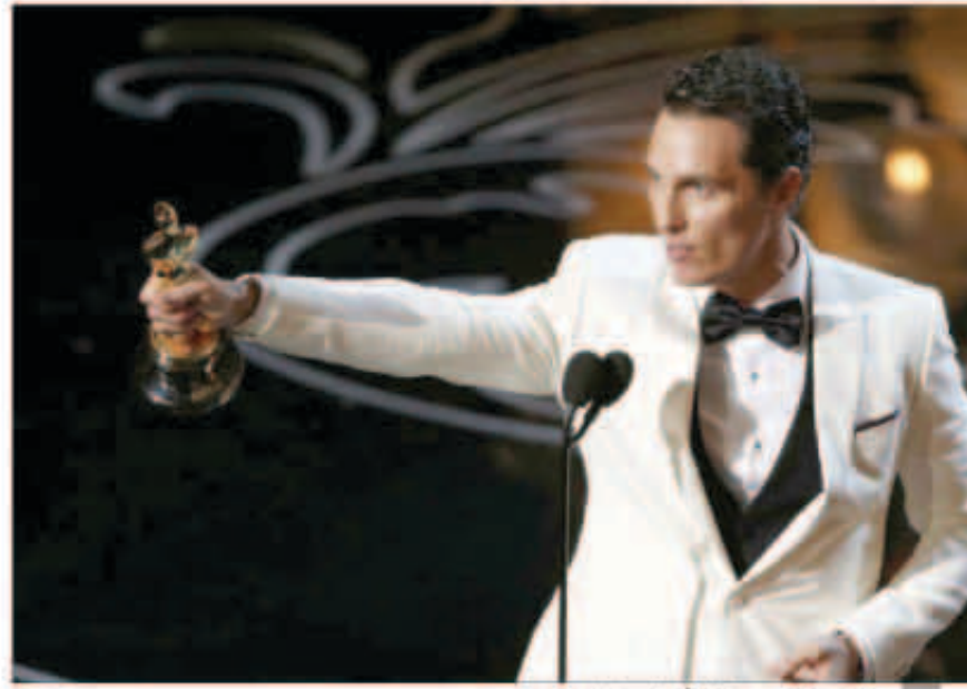
ماثيو ماكونهي وجائزة أفضل ممثل