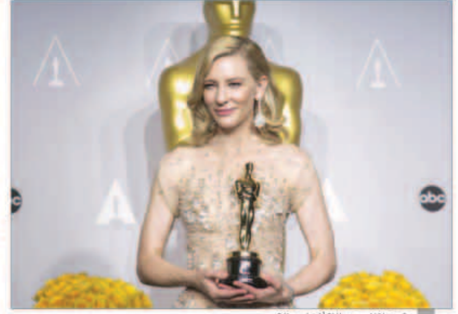
كيت بلانشيت وجائزة أفضل ممثلة

قصير، و«Helium» جائزة «أفضل فيلم قصير»، و«Mr. Hublot» جائزة «أفضل فيلم رسوم متحركة قصير». فيما فازت أغنية «Let it Go» من فيلم «Frozen» بجائزة «أفضل أغنية أصلية»، في حين كانت جائزة «أفضل سيناريو أصلي» من نصيب فيلم «Her». يذكر أن حفل توزيع جوائز الأوسكار هذه السنة، هو الحفل السنوي الـ86، وقد أقيم في لوس أنجلوس بولاية كاليفورنيا الأميركية وقدمته إيلين ديجينيريس.