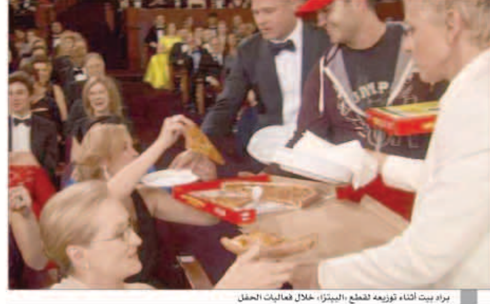
براد بيت أثناء توزيعه لقطع البيتزا، خلال فعاليات الحفل

كواليس انجلبنا تالقت وبدت مشرقة بستان من تصميم المصمم اللبناني العالمي ايلي صعب بينما خطيبها النجم براد بيت ارتدى بدلة أنيقة من توم فورد. الحدث الأبرز في حفل توزيع جوائز الأوسكار كان سقوط النجمة جينيفر لورانس على السجادة الحمراء. حطمت صورة نشرتها إيلين دي جينيريس على تويتر الرقم القياسي لإعادة التغريد، حيث وصل عدد التغريدات إلى 2.76 مليون تغريدة حتى الآن. التقطت عدسات المصورين مجموعة من الصور للنجم العالمي «براد بيت» أثناء توزيعه لقطع «البيتزا» خلال فعاليات حفل الأوسكار.