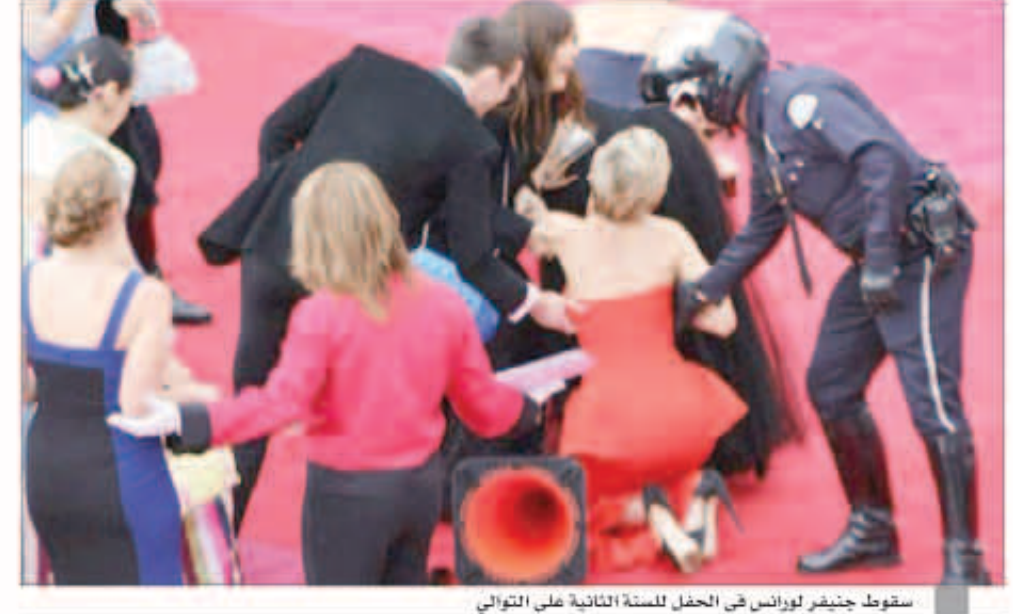
سقوط جينيفر لورانس في الحفل للسنة الثانية على التوالي

مصطفى الخاني «توأم سيامي» في «بواب الريح» قص مصطفى الخاني شريط ثاني مشاركته هذا الموسم، فيبدأ تصوير مشاهدته في مسلسل «بواب الريح» مع المخرج المنمن صبح في أول تعاون بينهما. السلامة أن النجم السوري سينسد شخصية ذات خصوصية يتم تناولها للمرة الأولى في الدراما العربية تعكس عشقه بتقديم «كركترات» بارزة ليس آخرها «النفس» في «باب الحارة»، و«خرطوش» في «حمام شامي»، وسيؤدي الخاني شخصية توأم «سيامي» ملتصق بتوأمه الآخر معن عبد الحيق في دوري شقيق ورفيق، علماً أن الإثنان تخرجا معا في المعهد العالي للفنون المسرحية، عام 2001 بمشروع مشترك بعنوان «كلاسيك» تحت إشراف جهاد سعد. ويتحدث «بواب الريح» عن الفتنة التي وقعت عام 1860 في جبل لبنان ودمشق، وهي من أهم أحداث القرن التاسع عشر، ويقنع المسلسل من الأحداث، لكنه لا يقدم توثيقاً تاريخياً