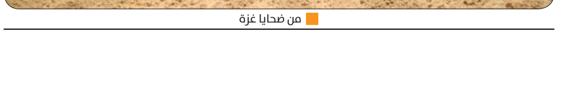
من ضحايا غزة