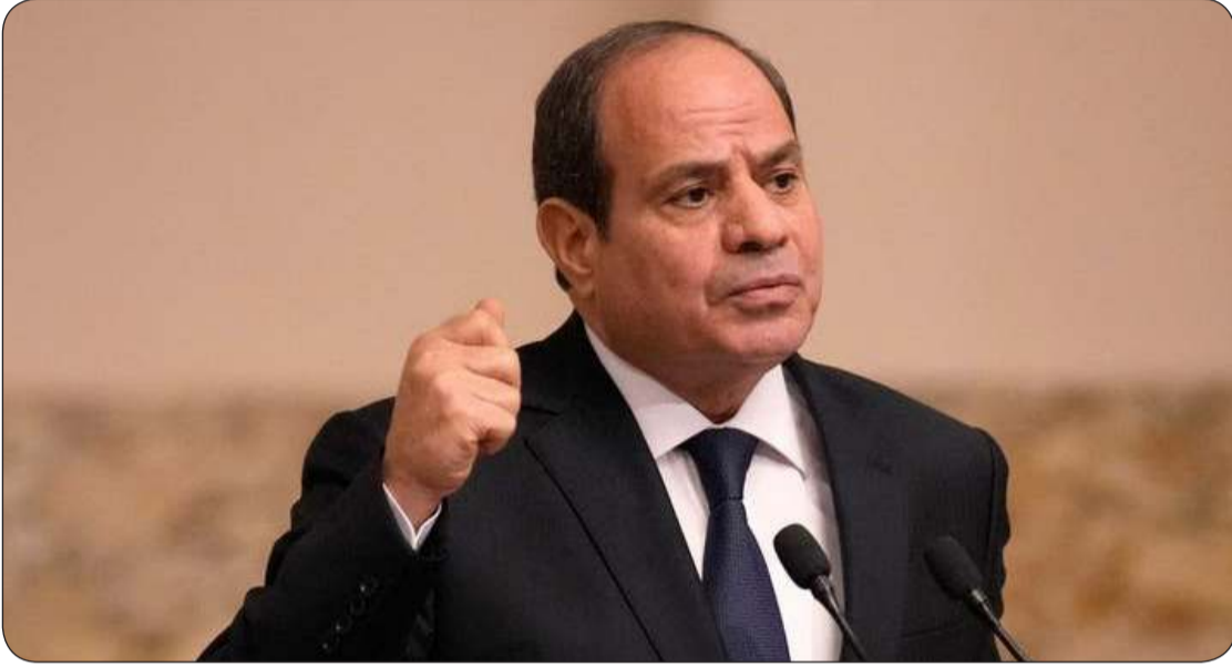
الرئيس المصري عبد الفتاح السيسي