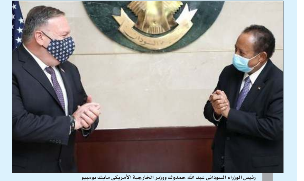
رئيس الوزراء السوداني عبد الله حمدوك ووزير الخارجية الأمريكي مايك بومبيو

بغداد - «وكالات»: أعلنت القائم بإعمال السفارة السودانية في واشنطن، أميرت عقارب، عن إنجاز تقدم كبير في مسار رفع اسم السودان من قائمة الدول الراحية للإرهاب. ونقل موقع «الراكوبة نيوز» السوداني اليوم السبت عن عقارب قولها إن التقدم كبير في هذا الملف حتى اللحظة. وأضافت «أنا عضو في لجنة التفاوض التي تبذل جهوداً كبيرة من أجل رفع اسم السودان من القائمة، وأكد أن هناك تقدماً كبيراً، معربة عن أملها في أن يتم رفع اسم السودان من قائمة الدول الراحية للإرهاب في أقرب فرصة ممكنة.