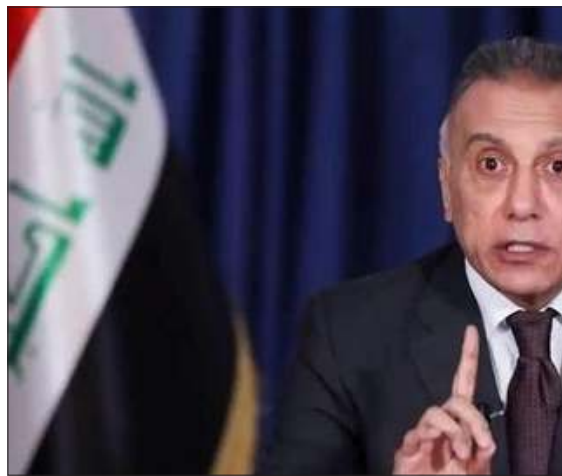
رئيس مجلس الوزراء العراقي مصطفى الكاظمي

زور جزيرة كنعوس في قضاء الشرفاء (110 كيلومتر شمالي تكريت)، مركز محافظة صلاح الدين والذي يعد أحد أهم معاقل عناصر داعش في المحافظة». وأضاف أن «الهجوم بدأ يقصف جوي من طائرات التحالف الدولي والمروحيات العراقية، وأن سحب الدخان المنبعث من الأماكن المقصوفة غطت سماء المنطقة». وأوضح أن القوات المشتركة شرعت بالتوغل بحذر في المنطقة، بعد تفجير عدد من العيون الناسفة التي زرعتها عناصر داعش عند مداخل المنطقة. وتعد منطقة زور كنعوس، وهي مجموعة جزر في نهر دجلة تغطيها نباتات كثيفة، من المعاقل المهمة في شمالي محافظة صلاح الدين ينطلق منها المسلحون لتنفيذ عمليات في المحيط القريب، وتحوي على طرق وعرة تربطها بمنطقة الجزيرة الغربية المؤدية إلى الحدود السورية العراقية. وكانت القوات العراقية قد دخلت مراراً إلى المنطقة لكنها لم تنجح فيها بسبب صعوبة مسكها من قبل القوات الأمنية، لوعورتها وكثافة غطائها النباتي الذي يسهل شن عمليات استنزاف فيها.