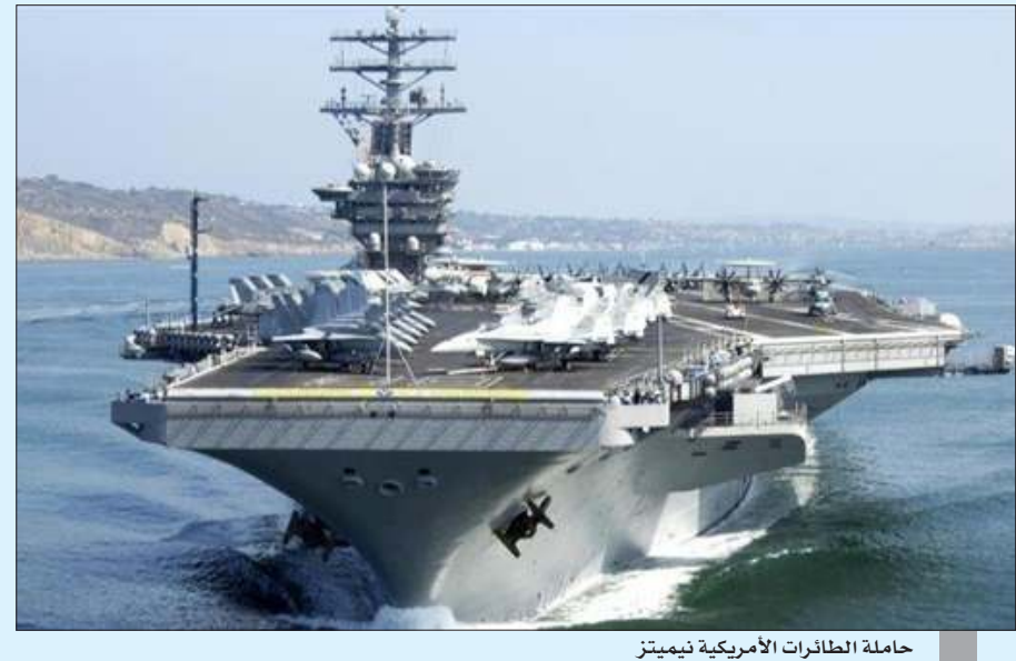
حاملة الطائرات الأمريكية نيميتز

«وكالات»: أعلنت البحرية الأمريكية أن حاملة طائرات، ويوارج بحرية مرت عبر مضيق هرمز نحو الخليج الجمعة فيما تهدد واشنطن بإعادة فرض عقوبات أممية على طهران دون دعم شركائها في مجلس الأمن. وذكر الأسطول الأمريكي الخامس في بيان أن مجموعة هجومية بقيادة حاملة الطائرات نيميتز، تضم طرادين مزودين بصواريخ موجهة كآ ومدمرة مزودة بصواريخ موجهة، أبحرت في الخليج للعمل والتدريب مع شركاء أمريكا ودعم التحالف الذي يقاوم داعش. وقال قائد المجموعة الهجومية الأدميرال جيم كريك: «تعمل مجموعة نيميتز سترايك في منطقة عمليات الأسطول الخامس منذ يوليو، وهي في ذروة الاستعداد». وجاءت الخطوة بعد أيام فقط من تعهد وزير الخارجية الأمريكي مايك بومبيو بفرض حظر على الأسلحة وعقوبات دولية أخرى ضد إيران، وتعهد بومبيو الثلاثاء بمنع واشنطن لإيران من شراء معدات عسكرية صينية وروسية، حتى مع اختلاف الحلفاء الأوروبيين مع واشنطن. وقال بومبيو: «ستتصرف على هذا النحو، ستمنع إيران من ملكية دبابات صينية ومنظومات دفاعية جوية روسية، وبعد ذلك بيع أسلحة