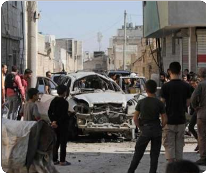
اشتباكات سابقة في حلب

عسكرية معطوبة و9 برادات و4 ناقلات محملة بمدافع كهربائية وسبع حاملات و8 مدرعات عسكرية تابعة لقوات الاحتلال الأمريكي». وأضافت المصادر أن «الرتل كان قادماً من ناحية تل حميس بريف القامشلي الجنوبي عبر طريق البترول وصولاً إلى معبر الوليد غير الشرعي سالكا الطريق العام بالقرب من مفرق قرية تل عدس».