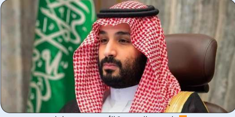
ولي عهد السعودية الأمير محمد بن سلمان

«وكالات»: قال مصدران دبلوماسيان السبت إن ولي عهد السعودية الأمير محمد بن سلمان سيزور مصر في 20 يونيو ضمن جولة بالمنطقة تشمل أيضا الأردن وتركيا. وأضاف المصدران أن الأمير محمد سيلتقي بالرئيس المصري عبدالفتاح