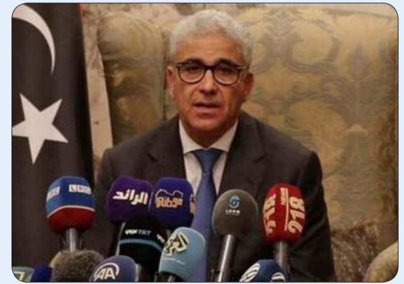
رئيس الحكومة المكلفة من البرلمان الليبي فتحى باشاغا

«وكالات»: دعا رئيس الحكومة المكلفة من البرلمان الليبي فتحى باشاغا، السبت، جميع الليبيين لأن يكونوا أكثر تسامحاً وتقبلاً للآخرين من أجل بناء دولة تسع الجميع.