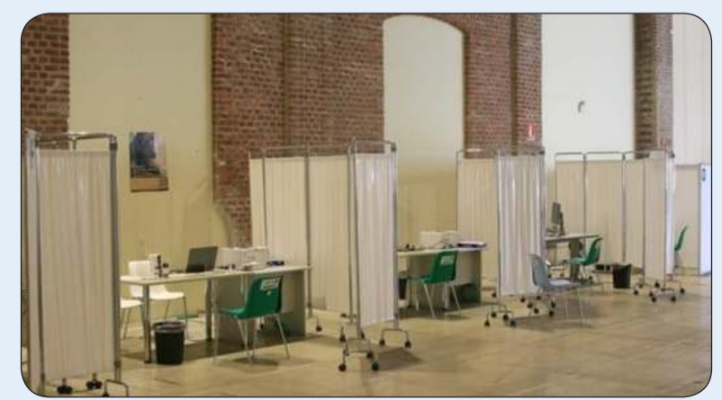
مركز لتوزيع اللقاحات المضادة لـ «كورونا»

«وكالات»: أظهرت بيانات مجمعة أن إجمالي عدد الإصابات بفيروس كورونا في أنحاء العالم وصل إلى 538.7 مليون حالة حتى صباح أمس الأحد.