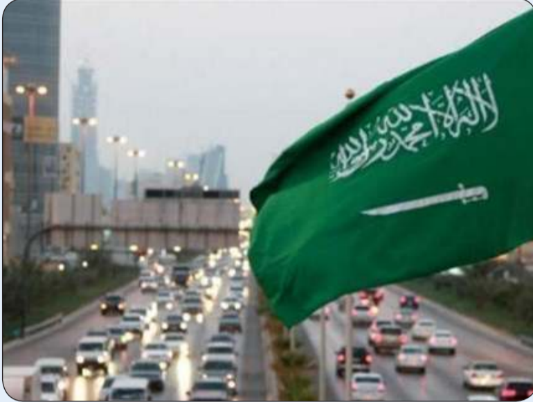
المملكة تبرعت بمبلغ مليونين ونصف مليون دولار لدعم مبادرة الوكالة الدولية للطاقة الذرية

الرياض - «وكالات»: أعلنت المملكة العربية السعودية عن تبرعها بـ 3.5 ملايين دولار، لدعم جهود ضمان الاستخدام الآمن للتقنية النووية. وذكرت وكالة الأنباء السعودية «واس» أمس أن المملكة، تبرعت بمبلغ مليونين ونصف مليون دولار لدعم مبادرة الوكالة الدولية للطاقة الذرية لتحديث مختبرات سايبرسدورف (مبادرة رينول-2) التي ستسهم في تعزيز القدرات الرقابية في المجالات النووية والإشعاعية بما يعظم الاستفادة من التقنيات النووية ويوفر الموارد والخدمات للدول الأعضاء في الوكالة، لضمان الاستخدام الآمن للتقنية النووية. كما تبرعت «المملكة بمبلغ مليون دولار،