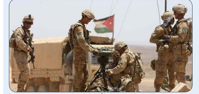
مناورات «الأسد المتأهب» في واقعة سابقة

«وكالات»: انطلق في الأردن تمرين «الأسد المتأهب» الذي تستمر حتى الخامس عشر من سبتمبر الحالي بمشاركة 27 دولة بينها الولايات المتحدة وبريطانيا وفرنسا وتتخلل المناورات عمليات حول مكافحة الإرهاب وتهديدات أسلحة الدمار الشامل. وقال الجيش الأردني في بيان إن هذه الدورة العاشرة من التدريبات التي تنظم على أرض المملكة، ستجري من 4 إلى 15 سبتمبر الجاري، موضحاً أنها تهدف إلى «العمل المشترك في مجال مكافحة الإرهاب وتطوير القدرات الأمنية والتعاون بين أجهزة ومؤسسات الدول المختلفة للاستجابة للتهديدات الأمنية والأزمات الداخلية». وأضاف البيان أن «هذا التمرين صمم على سيناريوهات تحاكي الواقع والظروف والتحديات التي يواجهها العالم أجمع ومنها خطر الإرهاب، ومحاكاة التهديدات الجديدة مثل استخدام أسلحة الدمار الشامل بمختلف الأنواع». وتابع أنه «سيتم خلال التمرين عقد العديد من اللقاءات والندوات التي ستجمع كبار القادة والشخصيات العسكرية والتي سيكون الهدف منها مناقشة أهم المشاكل والمعاضل التي تواجه العالم على الصعيد الأمني وكيفية معالجتها». وتقام التمارين في ميادين القوات المسلحة الأردنية ومراكز القيادة والسيطرة ومركز الملك عبد الله لتدريب العمليات الخاصة والمركز الوطني للأمن وإدارة الأزمات بمشاركة مختلف أنواع الأسلحة البرية والجوية والبحرية. وتشارك في هذه المناورات أيضاً، حسب البيان، ألمانيا وإيطاليا واليابان والنرويج وكازاخستان والنمسا والسويد وقبرص وكينيا واليونان وبولندا وبلجيكا وباكستان وأستراليا والسعودية والعراق ولبنان والإمارات والبحرين والكويت وعمان والمغرب إضافة إلى الأردن.