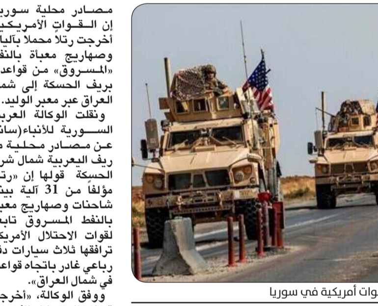
قوات أمريكية في سوريا

دمشق - «وكالات»: أعلن وزير الخارجية السوري فيصل مقداد، الأحد، عدم مشاركة بلاده في القمة العربية المقرر عقدها بالجزائر يومي 1 و2 نوفمبر المقبل. وقالت وزارة الخارجية والجلية الوطنية بالخارج الجزائرية إن الوزير رمان لعامرة، أجرى، الأحد، اتصالاً هاتفياً مع نظيره السوري فيصل المقداد، «في سياق استكمال المشاورات التي تقوم بها الجزائر مع الدول العربية لجمع كافة شروط نجاح القمة العربية التي ستعقد بالجزائر يومي الفاتح والثاني من شهر نوفمبر المقبل». وأضافت الوزارة أن علاقة الجمهورية العربية السورية بجامعة الدول العربية كانت «من جملة المسائل التي تمت مناقشتها بهذه المناسبة»، مبرزة أن المقداد أكد أن بلاده تفضل