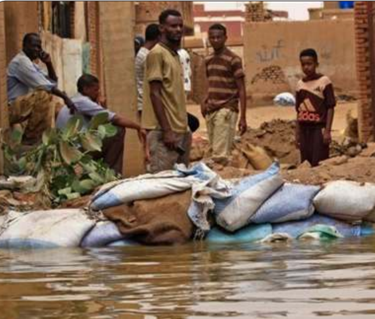
سودانيون متضررون جراء الفيضانات

الخرطوم - «وكالات»: ارتفعت حصيلة الفيضانات الناجمة عن السيول في السودان إلى وفاة 112، كما دمرت عشرات آلاف المنازل جراء هذه الفيضانات، بحسب ما قالت الشرطة الأحد. وتهطل أمطار غزيرة عادة في السودان بين شهري مايو وأكتوبر ما يؤدي إلى الإضرار بالمنازل والبنية الأساسية والمحاصيل. وأعلن السودان الأسبوع الماضي حال الطوارئ في ست ولايات بسبب الفيضانات. وقال الناطق الرسمي باسم الدفاع المدني لفرانس برس إن «عدد الوفيات بسبب السيول بلغ 112 إضافة إلى 115 إصابة»، كما أنه أكثر من 34 ألف منزل. وكانت السلطات أعلنت سقوط 79 قتيلاً بسبب الفيضانات في أغسطس الماضي. وقالت الأمم المتحدة، نقلاً عن البيانات الحكومية قبل أسبوع إن 226 ألف شخص تأثروا بالفيضانات في السودان. وكانت أكثر المناطق تضرراً ولايات القضايف وكسلا وشمال وجنوب كردفان إضافة إلى إقليم دار فور، وفقاً للأمم المتحدة. وحذرت الأمم المتحدة من أن السيول والفيضانات الناجمة عنها يمكن أن تؤثر على 460 ألف شخص، وهو رقم أعلى من المتوسط السنوي للمتضررين الذي بلغ 388 ألفاً بين 2017 و2021.