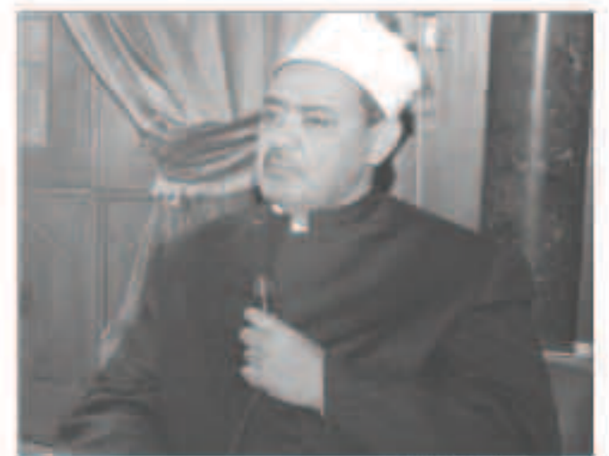
الشيخ احمد الطيب

القاهرة - وكالات : قال شيخ الازهر احمد الطيب في كلمة القاها اثناء استقباله وزير الخارجية السعودي الامير سعود الفيصل الاثنى ان اعضاء تنظيم الدولة الاسلامية «مجرمون يصرون صورة شوهاء عن الاسلام».