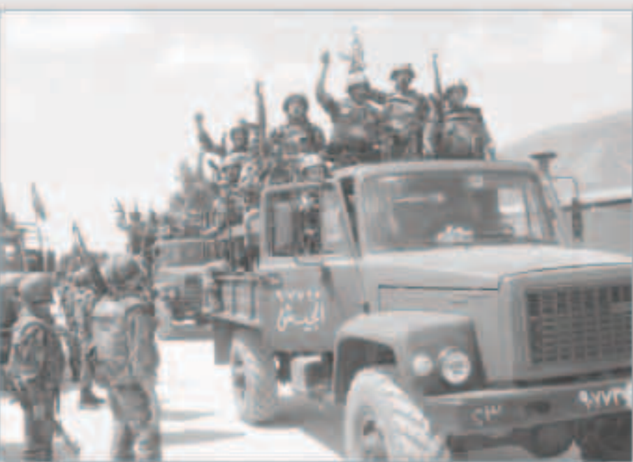
النظام السوري يحول مواجيات طاحنة مع «داعش»

دمشق - وكالات : قال نشطاء يوم الاثنى ان طائرات الحكومة السورية قتلت 60 مدنيا على الاقل بينهم اكثر من عشرة اطفال خلال يومين من الضربات الجوية لمناطق يسيطر عليها تنظيم الدولة الاسلامية في مطلع الاسبوع.