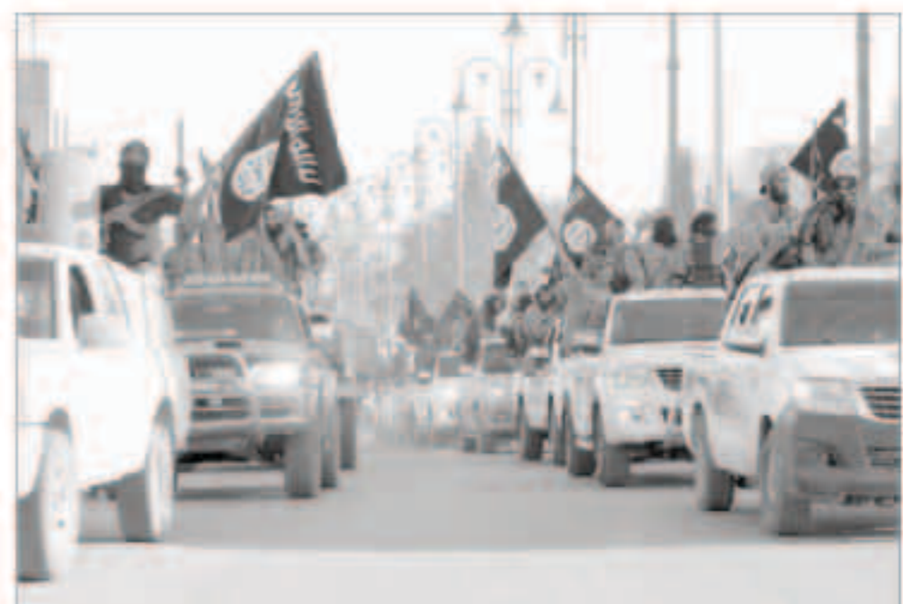
مقاتلون لداعش في العراق

انقرة «وكالات» - قال مسؤول اميركي ان وزير الدفاع الاميركي نيك هاجل سيسلط اراء زعماء تركيا بشأن «حجم استعدادهم للمشاركة» في تحالف تقوده واشنطن ضد تنظيم الدولة الاسلامية رغم قيام الجماعة المتشددة باحتجاز رهائن الترك علاوة على مخاوف أمنية محلية. وكانت تركيا الدولة المسلمة الوحيدة ضمن «تحالف اساسي» من عشر دول اجتمع على هامش قمة لحلف شمال الاطلسي في نيويورك بوايتز الاسبوع الماضي. وقال الرئيس الاميركي باراك اوباما عقب لقائه والرئيس التركي رجب طيب اردوغان يوم الجمعة انه يرحب بتعاون انقره.