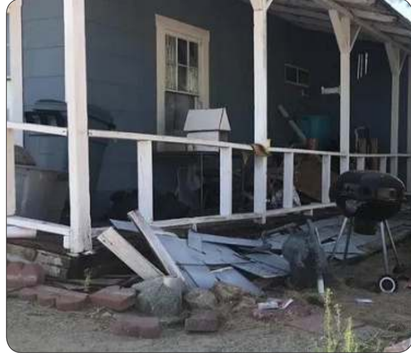
منزل في كاليفورنيا دمره الزلزال

كما سيتضمن التقرير توصيات تشريعية للمساعدة في تجنب وقوع