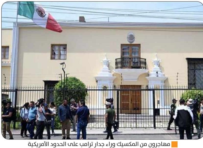
مهاجرون من المكسيك وراء جدار ترامب على الحدود الأمريكية

وأشارت وزيرة خارجية بيرو تاناسيليا جيرفاسي إلى أن زوجة كاستيو، ليليا بارديس موضع تحقيق من النيابة العامة التي تشتبه في أنها منسقة منظمة إجرامية قد يكون أثارها زوجها في السابق أيضاً. وأوضحت أن الحكومة البيروفية تحتفظ بحق طلب تسليمها من المكسيك إذا طلب القضاء المحلي ذلك.