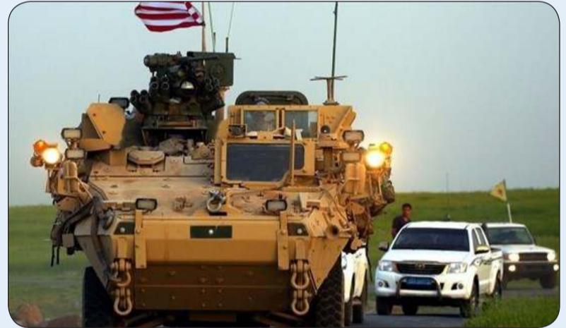
آلية عسكرية أمريكية في سوريا

«وكالات»: أعلنت القيادة المركزية للجيش الأمريكي (سنكوم) الثلاثاء تنفيذ قواتها خلال الساعات الـ48 الماضية ثلاث عمليات في شرق سوريا، اعتقلت خلالها ستة عناصر من داعش، بينهم قيادي متورط بالتخطيط لهجمات في سوريا.