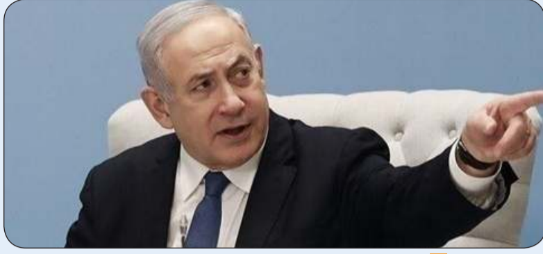
رئيس الوزراء الإسرائيلي المكلف بنيامين نتانياهو

«وكالات»: من المتوقع أن يعلن رئيس الوزراء الإسرائيلي المكلف بنيامين نتانياهو، الأربعاء، تشكيل حكومته مع حلفائه اليمينيين المتطرفين، رغم غياب اتفاقات نهائية معهم، إلا إذا طلب أيما إضافية في اللحظة الأخيرة. من جهة أخرى ضرب زلزال بقوة 6,4 درجة شمال كاليفورنيا، الثلاثاء، أسفر عن قتيلى و11 جريحاً، حسب السلطات المحلية الثلاثاء. وحرم الزلزال أكثر من 71 ألفاً من كهرباء في مقاطعة هومبولت، وفق موقع أكسيوس الإخباري. وقالت مقاطعة هومبولت في بيان صحافي إن «شخصين توفيا نتيجة لحالات طوارئ طبية أثناء أو بعد الزلزال مباشرة».