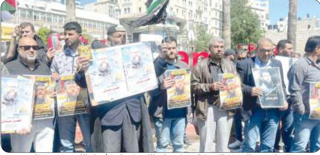
■ جانب من الوقفة التي نظمت في رام الله عقب استشهاد الأسير خضر عدنان