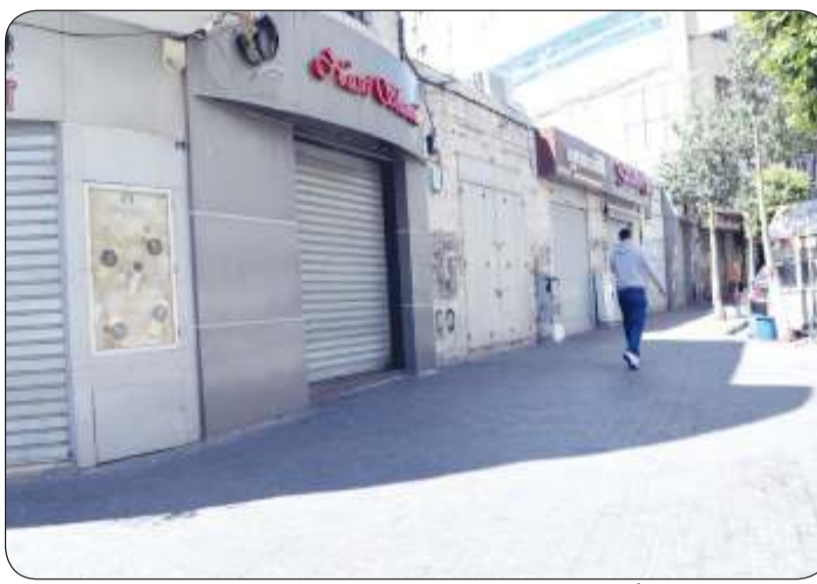
■ الأضراب يشل الحياة في رام الله والاراضي الفلسطينية حدادا