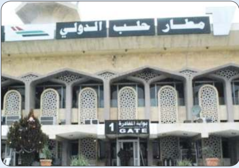
■ مطار حلب الدولي

وأسقطت عدداً من الصواريخ. وأوضح المصدر العسكري أن إسرائيل هاجمت بالمطار حلب جنوب شرق حلب مطار حلب الدولي وعددا من النقاط في محيط حلب، ما تسبب أيضا في بعض الخسائر المادية.