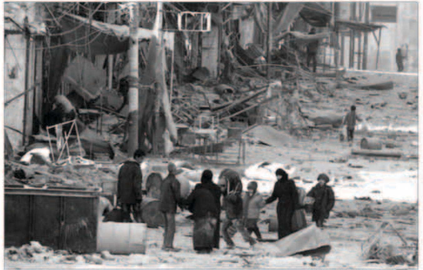
جوهه دوليه للافاء المدنيين في حلب

عواصم - وكالات - عقد مجلس الأمن الدولي اجتماعاً طارئاً، مساء الأربعاء، بطلب من فرنسا للباحث في الوضع المتدهور في شرق حلب. فيما دعت فرنسا الدول المعنية بملف الأزمة إلى اجتماع دولي حول سوريا في باريس في العاشر من ديسمبر.