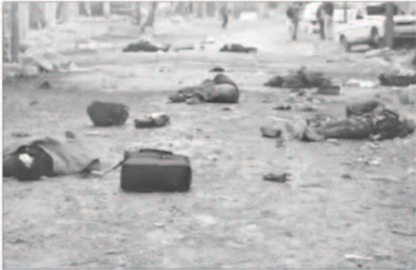
الحيث ملات شوارع حلب