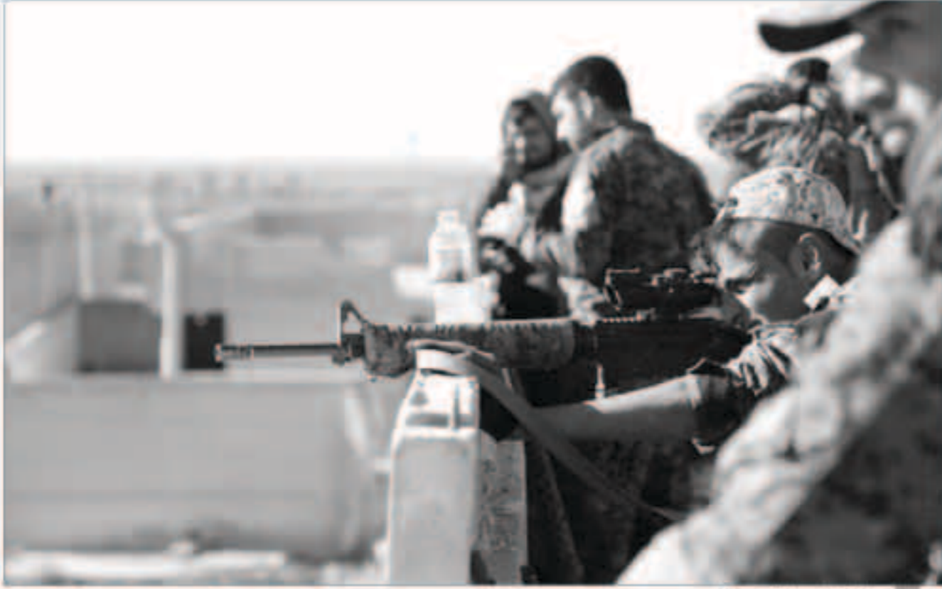
مقاتلون من سوريا الديمقراطية.