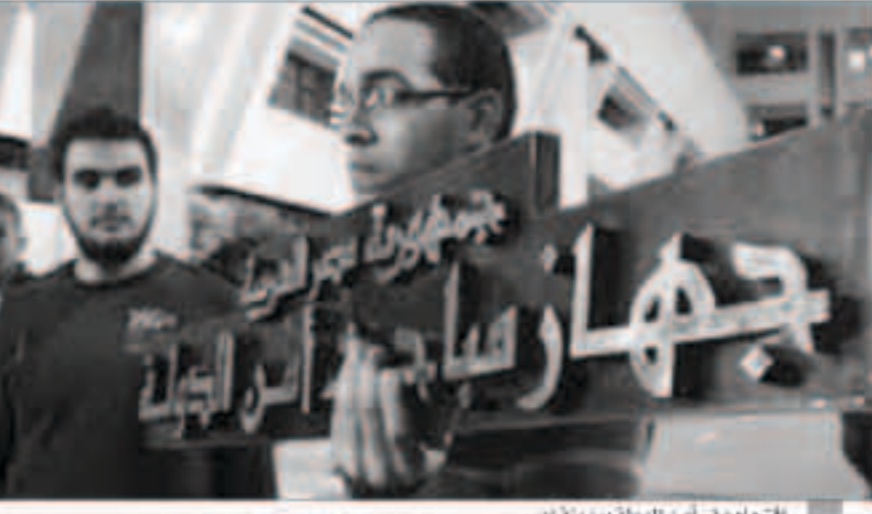
اقتحام مقر أمن الدولة بمدينة نصر

عشر في محاكمة 67 متهمًا، بينهم 51 محبوسين، باغتيال النائب العام السابق المستشار هشام بركات. لـ 21 فبراير الجاري لاستكمال سماع الشهود، كما قررت المحكمة تأجيل 8 من شهود الإثبات 1000 جنيه لكل منهم لعدم حضورهم جلسة أمس. والاحتفال بركات في يونيو 2015، في حادث تفجير استهدف موكبه بمنطقة مصر الجديدة بالمحاضرة، ليكون أكبر مسؤول مصري يقتل في حادث اغتيال منذ عزل الرئيس الإخواني المعزول محمد مرسي في يوليو 2013. وكشفت التحقيقات، عن ارتقاء المتهمين للتنظيم الإرهابي المسما «بإسقاط بيت المقدس»، وأسندت النيابة العامة لهم ارتكاب جرائم القتل العمد مع سبق الإصرار والترصد، والشروع فيه، وحيازة وإحراز أسلحة نارية بما لا يجوز الترخيص بحيازتها أو إحرازها، والخيانة التي تستعمل عليها، وحيازة وإحراز مفرقات (قنابل شديدة الانفجار) وتصنيعها، وأعداد جماعة استت على خلاف أحكام القانون بمعونات مادية ومالية مع العلم بما تدعو إليه تلك الجماعة وبوسائلها الإرهابية لتحقيق أهدافها.