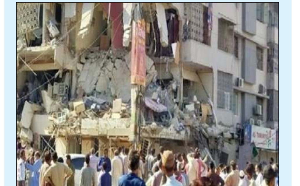
باكستانيون حول المبنى المتضرر من الانفجار