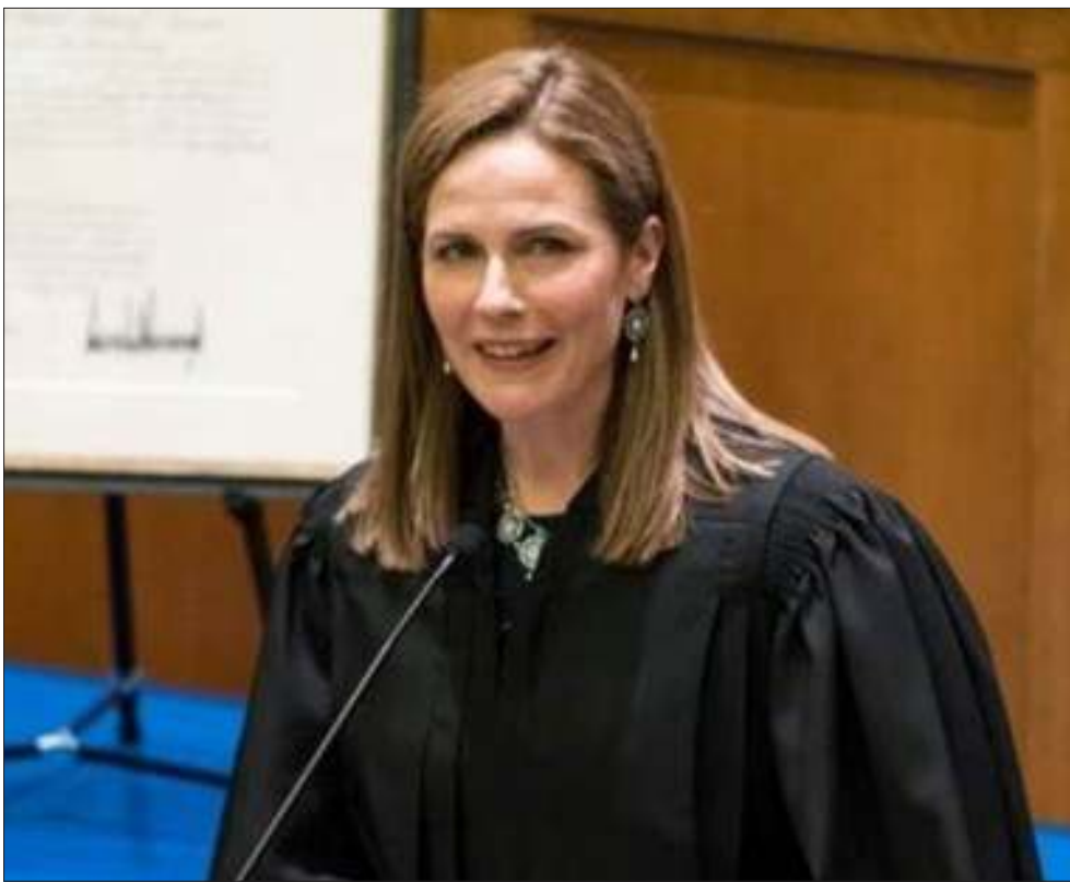
مرشحة ترامب للمحكمة الأمريكية العليا القاضي إيمي باريت

جورج فلويد، فضلا عن تجديد آلاف المناصب على المستوى المحلي، من مجالس تشريعية في الولايات، وقضاة، ورؤساء بلديات، ومجالس بلديات، ومأموري شرطة وغيرهم. من جهة أخرى أظهرت إحصاءات قدمت إلى لجنة الانتخابات الاتحادية الثلاثاء، دخول حملة المرشح الديمقراطي للرئاسة الأمريكية جو بايدن المرحلة الأخيرة من السباق بتفوق مالي كبير على الرئيس دونالد ترامب. وجمعت حملة نائب الرئيس السابق وانفقت أموالا أكثر من حملة ترامب في سبتمبر وأصبحت إعلاناتها يابدين السياسية أكثر انتشارا على شاشات التلفزيون الأمريكي. ولا يضمن تفوق بايدين في السباق المالي له النصر، إذ انتصر ترامب في انتخابات 2016 رغم أن المرشحة الديمقراطية هيلاري كلينتون، تجاوزته في الإنفاق. وفي نهاية سبتمبر كان لدى حملة بايدين حوالي 177 مليون دولار، أي ما يقارب 3 أضعاف الـ 63 مليون دولار لدى حملة ترامب. وجمعت حملة بايدين 281 مليون دولار خلال الشهر، أي أكثر من ثلاثة أضعاف ما جمعته حملة ترامب، وانفقت أكثر من ضعفي حملة. وانفقت حملة بايدين 56 مليون دولار على الإعلانات التلفزيونية والإذاعية في سبتمبر الماضي، مقارنة مع نحو 148 مليون دولار أنفقتها حملة بايدين. وقالت حملة بايدين إن «لديها مع الحزب الديمقراطي 432 مليون دولار». بينما قالت حملة ترامب إن «لترامب والحزب الجمهوري 251 مليون دولار فقط».