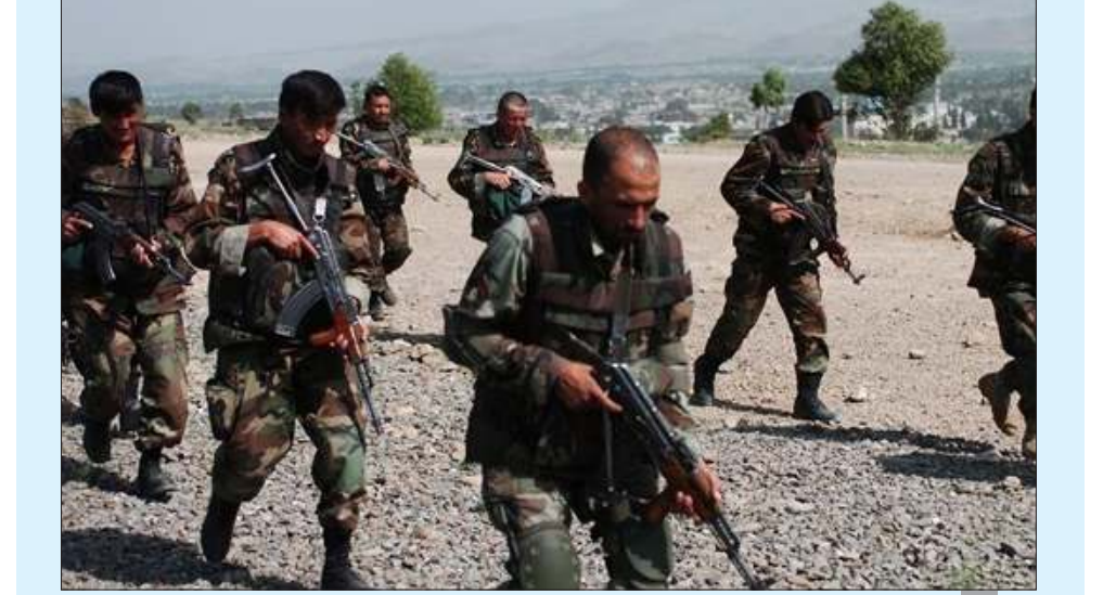
عناصر من قوات الأمن الأفغانية

كابول - «وكالات»: قال مسؤولون إن 34 عنصرا على الأقل من قوات الأمن الأفغانية لقوا حتفهم، بينهم مسؤول بارز في الشرطة، في هجمات لحركة طالبان بإقليم تخار شمال البلاد. وذكر مسؤولون محليون أن حصيلة القتلى وصلت إلى 42 شخصا، وتابعوا أن المسلحين