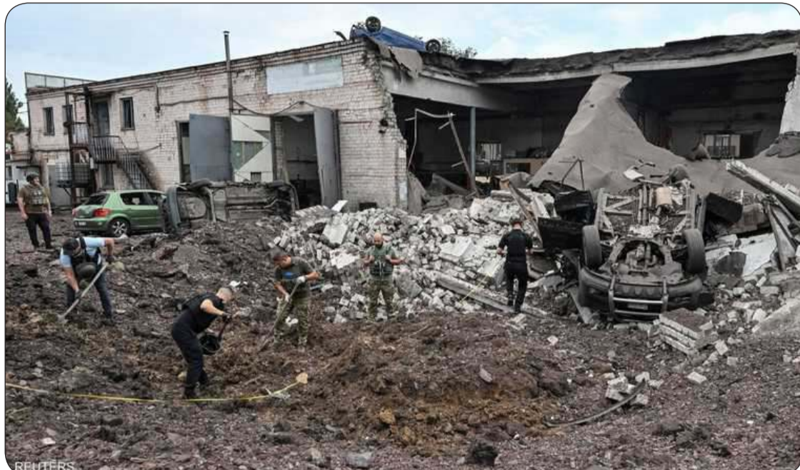
الجيش الروسي ركز هجومه على منطقة دونيتسك