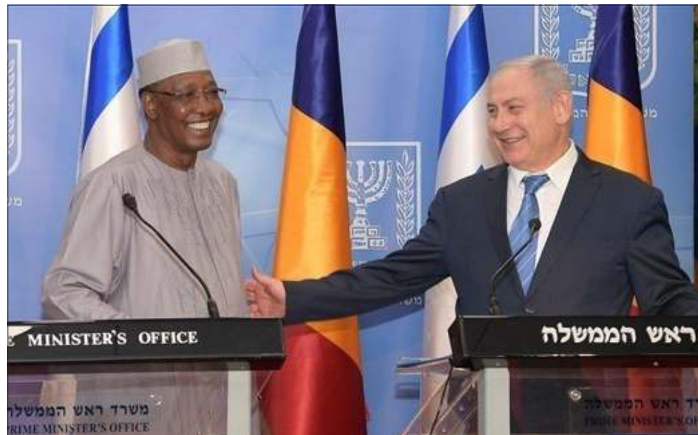
الوزراء الإسرائيلي بنيامين نتنياهو والرئيس التشادي إدريس ديبي

لكن مساء الإثنين، نشر الصحافي في القناة 12 في التلفزيون الإسرائيلي أميت سيغال وناثق أظهرت أن الشرطة أجرت في حينه تحقيقاً داخلياً أثبت أن مقتل أبو القيعان نجم عن خطأ فادح ارتكبه عناصر الشرطة وأن قائد الشرطة في حينه رونى الشيخ أضر عدم نشر الحقيقة والإبقاء على الرواية التي تتهم أبو القيعان بالإرهاب. ونشر سيغال رسالة أرسلها عبر البريد الإلكتروني أحد المدعين