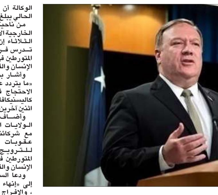
وزير الخارجية الأمريكي مايك بومبيو

وكانت الوكالة الدولية للطاقة الذرية أعلنت يوم الجمعة أن المخزون الإيراني يتجاوز عشر