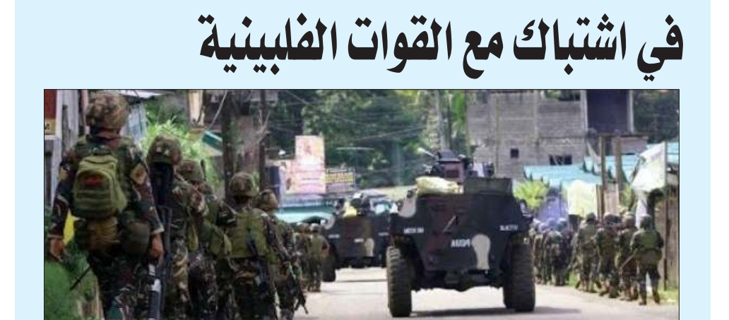
جنود من الجيش الفلبيني في عملية ضد جماعة أبو سياف

مانيلا - «وكالات»: أعلن الجيش الفلبيني أن 5 أشخاص شُبه في أنهم متشددون إسلاميون قتلوا الخميس في اشتباك مع القوات الحكومية جنوب الفلبين.