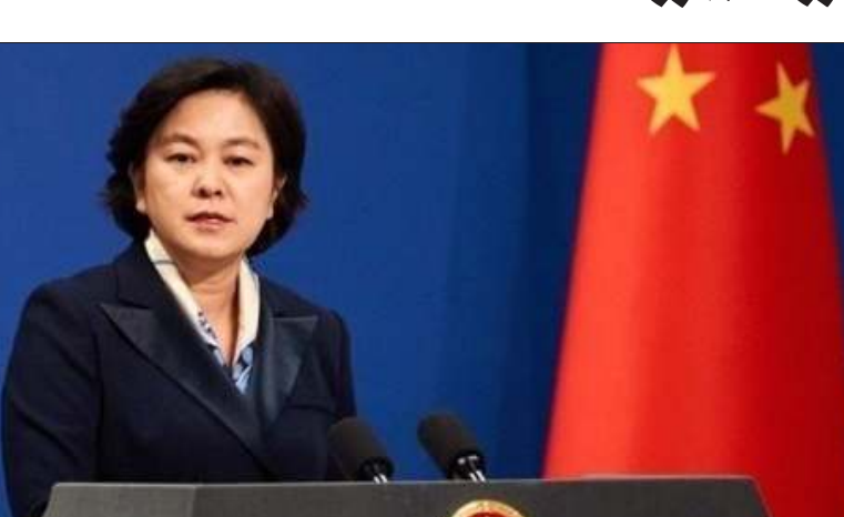
المتحدثة باسم وزارة الخارجية الصينية هوا تشونينغ

بكين - «وكالات»: قالت وسائل إعلام صينية، الثلاثاء، إن الصين تخطط لفرض عقوبات على مسؤولين أمريكيين كانوا على اتصال رسمي مع تايوان.