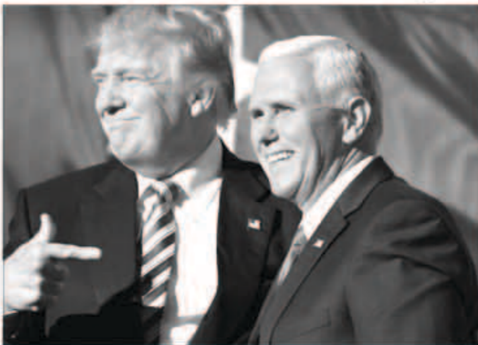
الرئيس الأمريكي دونالد ترامب و مايك بنس

وقال المسؤول «إن إعادة توطين الناس في أماكن قريبة من أوطانهم بعد استخدام أفضل لأموال دافعي الضرائب».