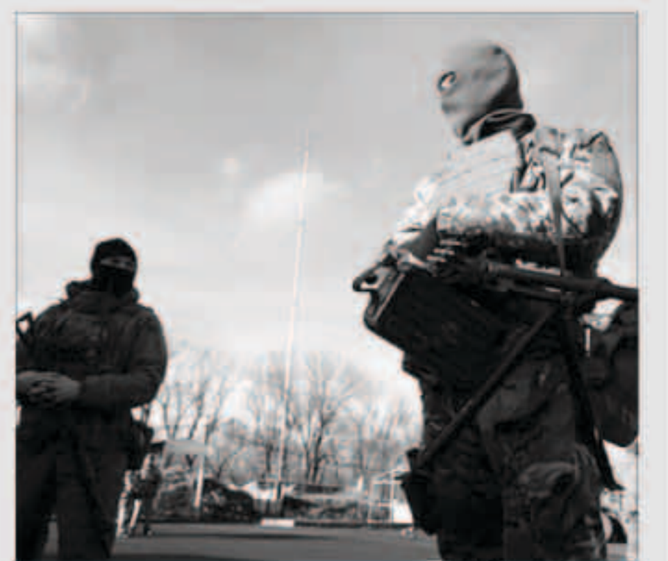
جنود روس في أوكرانيا

موسكو - وكالات: أعلن التلفزيون الحكومي الروسي، أن الاستعدادات بدأت، أمس السبت، لتبادل أسرى بين روسيا وأوكرانيا، ونشر لقطات لحافلات تقادر سجن