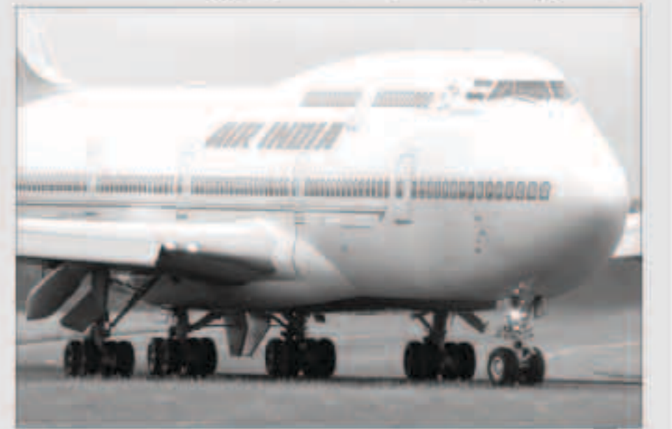
طائرة الرئاسة الهندية

وباتي القرار على وقع تصاعد حدة التوتر المرتبط بمنطقة كشمير بين البلدين الجارين المسلحين نوبيا. وقال وزير الخارجية الباكستاني شاه محمود قرشي في بيان، إن «القرار اتخذ نظراً لسلوك الهند».