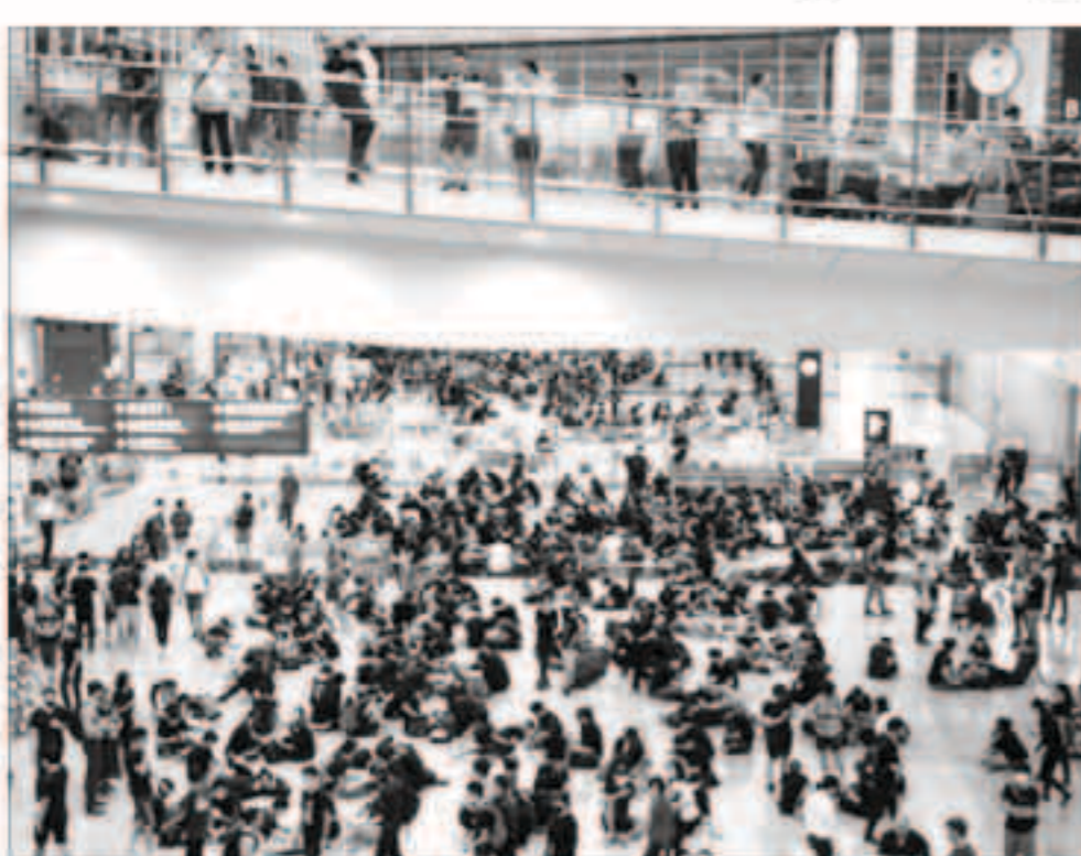
تظاهرات سابقة في مطار هونغ كونغ

«وكالات»: يعتزم المحتجون في هونغ كونغ تعطيل أحد أكثر مطارات العالم ازدحاماً، أمس السبت، بعد ليلة شابتها العنف استخدمت خلالها الشرطة الغاز المسيل للدموع والطلقات المطاطية لتفريق حشود في أحدث اشتباكات خلال الاحتجاجات المناهضة للحكومة والمستمرة في تلك المدينة التي تحكمها الصين.