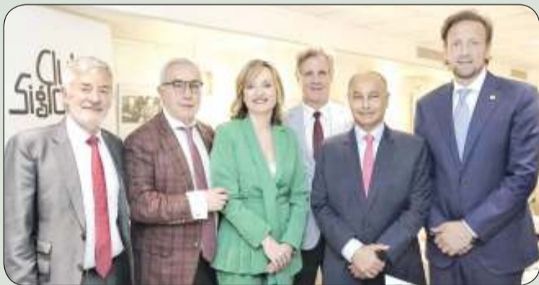
المسلم يتوسط اللقطة الجماعية مع الوزيرة مونيكا قارسيا

كافة الدول، ونشرها في المناطق النائية، من أجل خلق أجيال رياضية متعاقبة، في مجال السياحة.