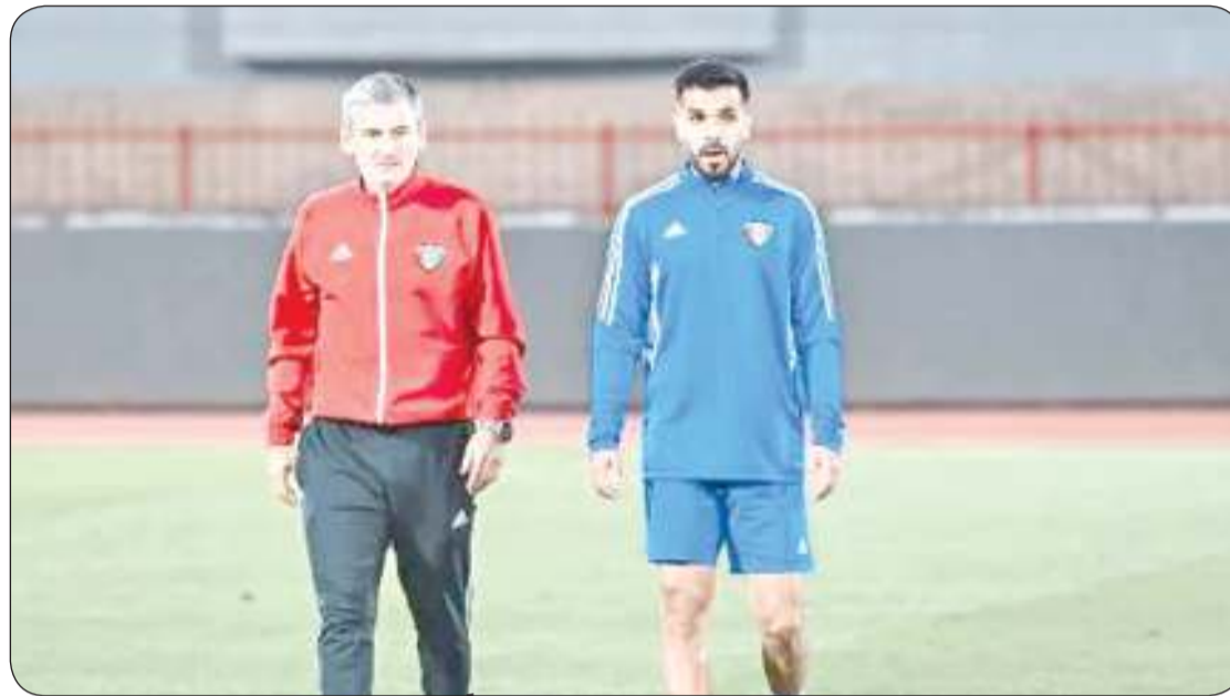
بينتو يستدعي 26 لاعبا

لقطع في الرباط الصليبي. وسبق السلامة لإصابة الرباط الصليبي، العديد من المواهب الكويتية، ومنهم من شكلت له هذه الإصابة هاجسا لم يتمكن الخالص منه إلا مع اعتزال الملاعب. ويعتبر عبد الله وبران لاعب منتخب الكويت، وأحمد عجب، وفرج لهيب، وجاسم الهويدي، ومساعد ندا، وسيف الحشان، ومحمد فريح وغيرهم الكثير من لاعبي الأجيال السابقة، أبرز من عانوا من الرباط الصليبي، وكانت تلك الإصابة سببا في ابتعاد الكثير منهم عن الملاعب. وفي الفترات الأخيرة، عانى موهبة نادي الكويت، أحمد حزام من تلك الإصابة التي